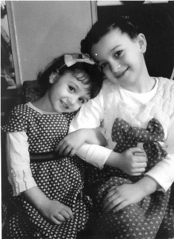
ბეჟანის შვილიშვილები – გვანცა და ბარბარე.

ჭეშმარიტი პოეზიის მთავარ პოსტულატებს – ცას და მინას ერთდროულად ვიპოვით ბეჟან ხარაიშვილის პოეზიაში: „... რომ გამოვცადო ცის სიახლოვე, მინაზე ბოლო სუნთქვას ვიმეტებ“ (...და ვტოვებ, ვტოვებ).