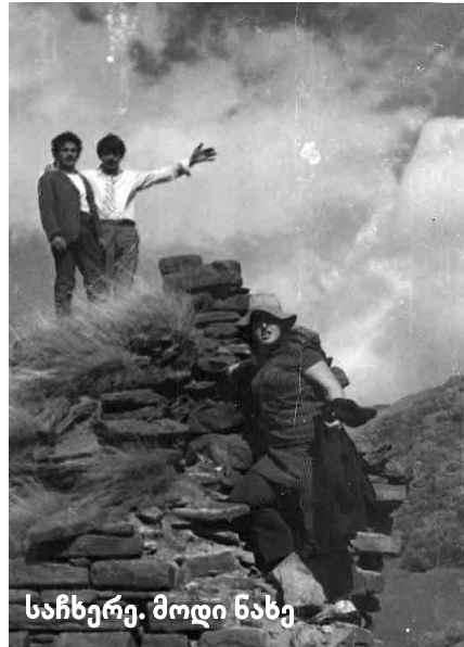
საჩხერე. მოდი ნახე

ლექსში „ხევსურეთი“ ხევსური მოიაზრება, როგორც ეროვნული სულის, მამა-პაპის სისხლის მატარებელი ქართველი, ხმელი წიფლის, ორწყალის ფონზე, სიკვდილის დასამარცხებლად შემართული: „ორწყალთან შედგა შემთვრალი