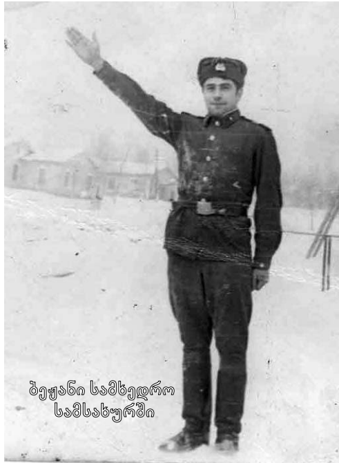
ბეჟანის სამხედრო სამსახურში

ყველა ეს სახე პოეტების მეფესთან მიმანიშნებელია მუხანათი მეზობლის, თოვლიან – ყინულიანი იმპერიის სატანურ, მზაკვრულ პოლიტიკაზე, მის ავ ზრახვებზე. ლექსში „ოფორტი“ გალაკტიონი ენიგმებით მიგვახვედრებს, რომ ჩვენი სამშობლო ჩრდილოეთის ავდრიანი, ცივი იმპერიის მიერ დამონებულია და ეს მონსტრი გვაიძულებს, თავისი თოვლიან-ყინულიანი სახელმწიფო საკუთარ