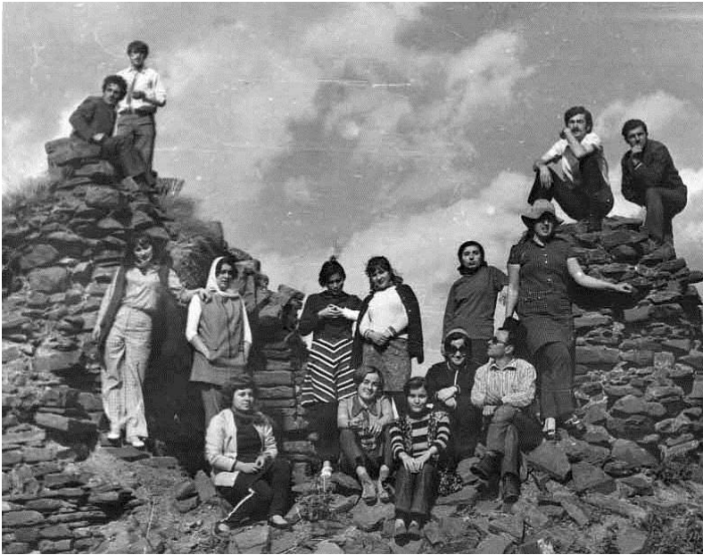
სტუდენტობის პერიოდი. საჩხერე. მოდი ნახე.

სიკვდილის შიშის დაძლევის საშუალებაა იმის შეგნება, რომ იგი „ახალი სიცოცხლის დასაბამია“ (მიშელ მონტენი, „ცდები“).