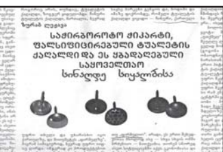
საქართველოს მთავრობის განცხადებით...