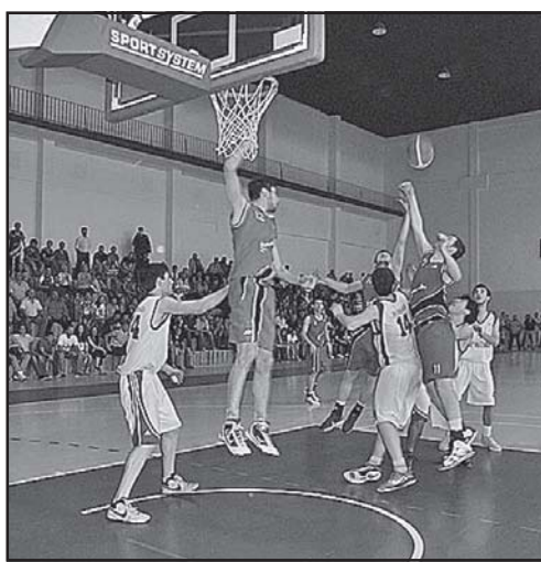
შენველარაში ორმომცემი 20 ქულა შემოსტრიალდა...