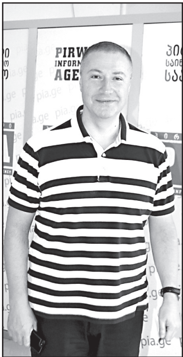
„ყოფილ პრემიერსა და მის გუნდს წაღებულ ფულს უკან მოატანინებენ“

— საერთოდ არ აინტერესებს მარგველაშვილს კვირიკაშვილი, მისი გვარი ისე ასეა. გასაკვირი ისაა, რომ გაახსენდა, არ ესხენებინა, ეს უფრო ბუნებრივი იქნებოდა. რა მნიშვნელობა აქვს, ვინ იქნება მთავრობის მეთაური, ერთი ჩომბე გაუშვებს და მის ადგილზე არსაიდან მოსული, გაჯგომი-