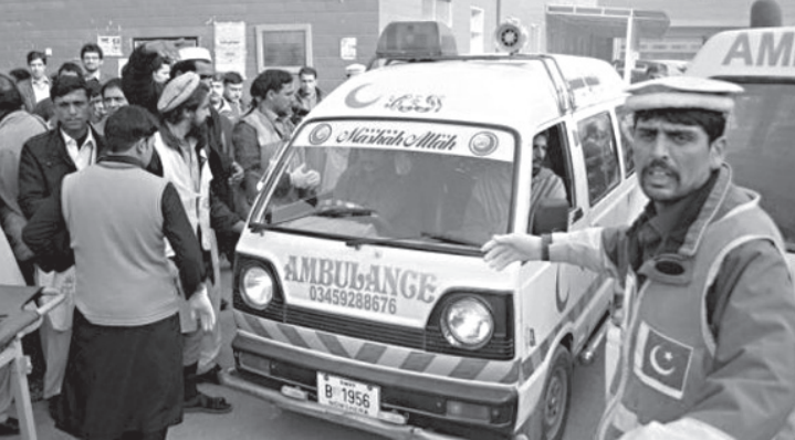
მოამზადა ნიკა თევზაქემ

აკისტანელ ულტრამემარჯვენე პოლიტიკური მოძრაობების ალიანსის ლიდერის წინასაარჩევნო მიტინგის მასობრივად მომხდარი აფეთქების შედეგად 4 ადამიანი დაიღუპა და 31 ადამიანი დაშავდა. აფეთქება 13 ივლისს დილით ქალაქ ბანაში, მუტაჰიდ მაჯლის-ე-ამალ აპრამ ხან დურანის წინასაარჩევნო მიტინგის ჩატარების ადგილიდან 50 მეტრში მოხდა. ადგილზე 40 პოლიციელი მივიდა. დაშავებულები უახლოეს საავადმყოფოში გადაიყვანეს. დურანის განცხადებით, ეს მასზე რიგით მეხუთე თავდასხმაა. — პოლიცია მავრთხილებდა, რომ ჩემს სიცოცხლეს საფრთხე ემუქრება. თუმცა ახლა აფეთქებამ მხოლოდ ჩემი ავტომობილი გაანადგურა, — განაცხადა დურანი.