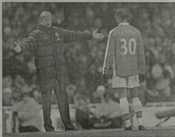
ვენდერი და ტრაორე ევერტონთან მატჩის დროს. ასე ანაფერი გამოვა, მამა...