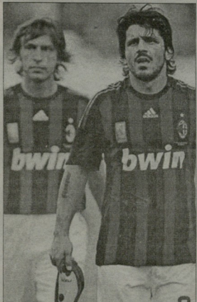
საყრდენი ნახევარმცველები, რომლებიც კლასიკურ 4-4-2-ში იდგებიან...