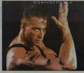
სახის დასახიობების მიმი აქვს. ტალიანდელი მებრძოლის პოპულარი 100 ათასი ფლორი იქნება. ამ თანხაში იმ წილის ბრძოლის ტრანსპარტიდამ მიღებული იქნება.

როგორც ცნობილია, ჩხუბი მუაი-ტაის წესებით ჩატარდება, მაგრამ იდეალური დარტმები თავად მსახიობის ბიოგრაფია იქნება არცხალული - ვან დას