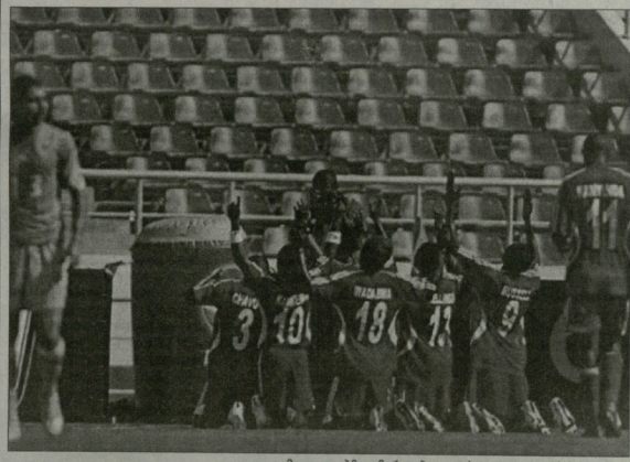
მალაგლებმა გამარჯვება დალულ ტოკოვებს მოუტანეს

ტოკოსგან დამატებულ B გვეუბნები გუნდის ერთ-ერთი მატჩი გამართა, აფრიკის ერთი თასის ფორცვლილი კობ დეფურემა ვერაფერი მოხერხებულა ბურკინა-ფასოს ნაერბის - 0:0. სასწაულებანი გვეუბნები უკვე კი ბოლოში განის ნაერბი, რომელმაც ტოკოსთან მატჩი გაუშვინა. სხვათა შორის, ეს შეხვედრა კანინანსი განთავის, პრინციპის, სადაც სეპარაციისგან ტოკოს ნაერბის დედეგის სამი წევრი მიუკვლეს, ორი ფეხბურთელი კი მინუტ დაკარგა. „პარსელონის“ ნახევარსეკუნდი მალა გუნდმა ხელიდან. ერთ იპოზიტი დიდი დროცა საფარიში უკლებლივ მიცვლა, თუკი მსაჯამა ამაკა უნდა იქნა არ დამინა. მიუხედავად ფეხბურთელი მოპოვებული ქულითა განთავის უნდა იყვნენ. პარსელონის კობ დეფურეც მას შეხვედრა, ბურკინა-ფასო კი ისევინა.