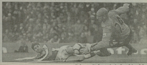
არსენალი-ვერტონი. იღვაროსი გამოყვანებულ მანსი...