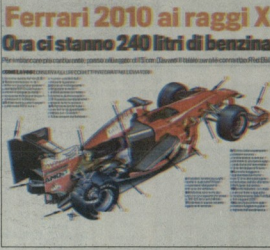
Ferrari 2010 ai raggi X Ora ci stanno 240 litri di benzina

ბუნებრივია, ახალი ფორარის ბევრი სხვა სახის დეკორები, მაგრამ მის შესახებ უფრო კონკრეტულად