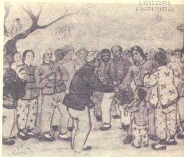
ჩინელი გვირის შეხვედრა თანასოფლელებთან