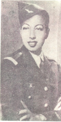
ამ სურათზე არსდნის ბეკერი, გაღატაკებული საბჭოეთის ფრონტში, რომელსაც მერე მსოფლიო ომის წლის, იმყოფებოდა რა „აფეთქებულ სანარკვეთის“ შერაბე- ბულ რაზმში შემადგენლობდა.