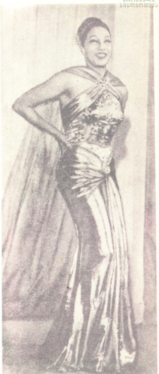
ახეთია ეროვნება ბეკერი

მილანდის ციხე-კოშკთან არის ერთი პატარა სოფელი კასტელნო-ფიზიოლოგებში 15 წლის წინან მიატოვეს მცხოვრებლებმა ახალი პატარების წყალობით და მათ მიერ მოზოიდული მხახკელების მეშვეობით, სოფელი ისევ გაიკაცხლა და ახლა იქ საშოკე მეტი ოჯახი ცხოვრობს. იქ არის დუქნები, თეატრი, სასტუმრო, რომლის ყოველ ოთახს რომელიმე სახელმწიფოს სახელი ჰქვია. ეროვნების ერთ-ერთ დას აქვს საკუთარი სკოლიტიტო. 1949 წელს ამ სოფელში ჩამოვიდა ეროვნების დედა და პირველად იხილა თავისი ქალიშვილი სცენაზე. ის იყო სოფელ კასტელნოს თეატრის სცენა. ეს სოფელი ნამდვილი „ბედნიერების სოფელია“.