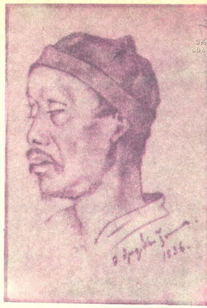
ჩინელი მუშის პორტრეტი

დიდი გემოვნებით დაჯილდოებული, ნიჭიერი მხატვრის ნაშრომები 1984 წელს გამოფინეს მოსკოვში — აღმოსავლეთის კულტურის მუზეუმში. რუსულმა პრესამ დადებითად შეაფასა მღერბრევილის მოღვაწეობა, უკლამი უქრ და მარჯვენა დაულოცა. 1984 წელს მადრიდში მღერბრევილი ჩინეთში გაემგზავრა, იგი სინძიანის პროვინციაში ცხოვრობდა და მოღვაწეობდა. გამოყენდა რა ირანში დაუფლებული მინიატურული ტექნიკა, მან მთელი რიგი კომპოზიციები შექმნა ჩინურ თემებზე, როგორცია: „შემოდგომა ჩინეთში“, „ბაზარი ჩინეთში“