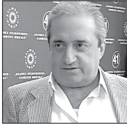
ყველა ჩვენს საქმეს საშუალოდ მაინც გავაკეთებთ, ჩვენი ქვეყანა გაბრწყინდება.

– მსმენელი და მსაყურებელი მე არასოდეს არ მაკლდა და მათი მხარდაჭერა ყოველთვის იყო საოცარი აღმაფრენი და შემოქმედებითი ნარმატივის საოცარი მუხტი, ამიტომ მადლობა ყველას, ვინც მხარს მიჭერდა და მიჭერს ტაშით და ოვალით. მომღერლებს, მსახიობებს, ექიმებს ძალიან ვიხივ, რომ თავისი საქმეები აკეთონ, საქმე, რომელიც მათ შესანიშნავად ხელეწიფებათ. მომღერლებმა იმდროინდელი, მწერლებმა წერეთ, ექიმებმა იქიქიქით, პოლიტიკოსებმა მიხედონ ძალიან რთულ მდგომარეობაში მყოფ ჩვენს პოლიტიკას. ეს არის ჩემი უმორჩილესი თხოვნა. არ იფიქროთ, რომ მე ძალიან კატეგორიული ვარ, მაგრამ მე მგონი, ასე აჯობებს ჩვენი ბედკრული ქვეყნისთვის და დარწმუნებული ვარ, თუკი ჩვენ