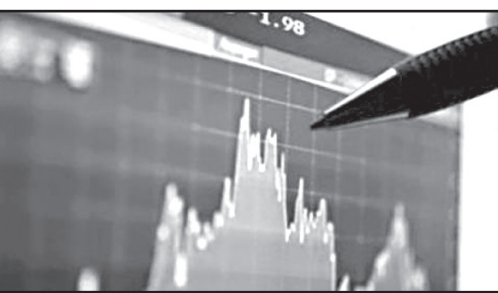
მოამზადა ნიკა თევზაძემ

შესაძლო მსხვერპლისა და ნგრევის შესახებ ინფორმაცია არ გავრცელებულა.