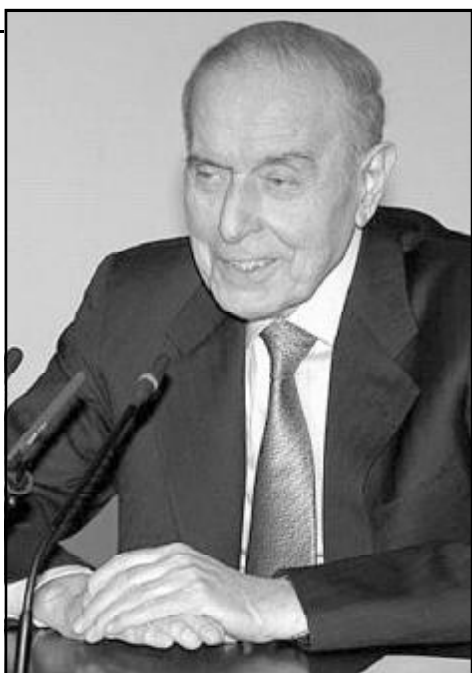
ერი მომავლის უზრუნველყოფის, რეგიონსა და მთლიანად ევროპაში სტაბილურობის დაცვის გარანტია.

მემკვიდრეობისადმი ერთგულების საქმეში აზერბაიჯანის პრეზიდენტის ილჰამ ალიევის მაგალითი ხელს უწყობს ჩვენი ქვეყნების მეგობრულ ურთიერთობათა გაღრმავებას, ეკონომიკური სტრატეგიის განვითარებას. და ეს არის ჩვენი ქვეყნებისა და ხალხების ბედნი-