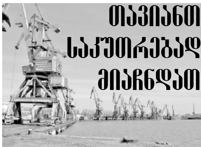
ნოვოროსიისკის - 6 დოლარი, ტრაბზონის - 2,95 და ბანდერაბასის - 1,4 დოლარი.

სპეციალისტების მტკიცებით, დოლიძისთვის ქვეყნის ყოფილი პირველი პირის მხრიდან სასათბურე პირობების შექმნამ და ყველა კანონის დარღვევაზე ხელის დაფარვამ გამოიწვია ის, რომ ტვირთებმა ის ყოფილი რეგიონის სხვა პორტებისაკენ გადაამისამართება, ასეთი კი შავი ზღვის აუზში მრავლადაა. ოფიციალური მონაცემებით თურქეთმა 2011 წელს ფოთის პორტის გავლით მიიღო 424 55 ტ. ტვირთი, 2012 წელს კი - 270 293 ტ; უკრაინამ 2011 წ. - 118 908 ტ, 2012-ში - 59023 ტ. რუსეთმა 2011 წ. - 76828 ტ, 2012 წ. - 41 911 ტ.