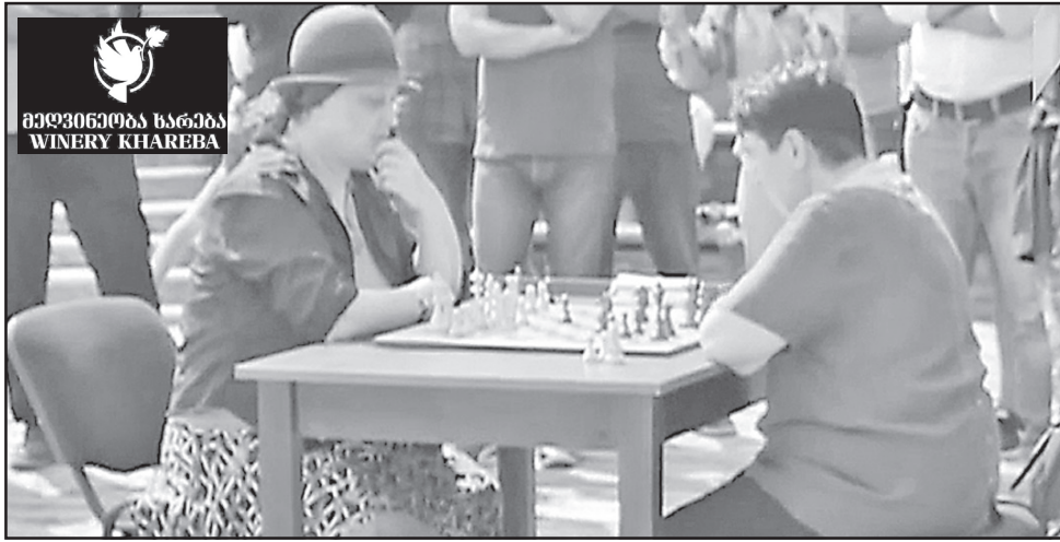
ვითარება და პოპულარიზაცია. ღვინო ჩვენი ქვეყნის სავიზიტო ბარათია, ამიტომ საჭადრაკო ოლიმპიადის

საშუალებას მოგვცემს კიდევ უფრო მეტად ადამიანს გააცნოს ქართული ღვინო, - მიიჩნევენ კომპანიაში.