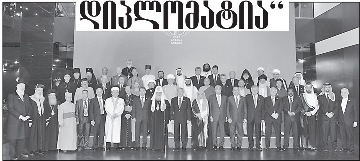
თხელ: 2006, 2009, 2012 და 2015 წლებში ყოველი ეს შეკრება მთავრდებოდა შემაჯამებელი დეკლარაციის ხელმოწერით. ამ დოკუმენტში დელეგატები აცხადებენ თავიანთი ერთობლივი მოქმედებების შესახებ, მშვიდობის უზრუნველყოფისა და შენარჩუნების მიზნით, ასევე მონოდეტით მიმართავენ მსოფლიო საზოგადოებრიობას. ეს დოკუმენტები ყველასათვის ხელმისაწვდომია.

მსოფლიო სულ უფრო ნაკლებად მშვიდობიანი ხდება, რასაც 2018 წლის მშვიდობის გლობალური ინდექსი (GPI) ადასტურებს. კვლევის შედეგების მიხედვით, კონფლიქტურობის დონემ მკვეთრად მოიმატა. დღევანდელი განსაკუთრებული კიდევ იმაში მდგომარეობს, რომ მორაველდა რელიგიური ფაქტორით განპირობებული კონფლიქტები. ამიტომ საერთაშორისო თანამეგობრობას დიალოგისა და კონსენსუსისათვის განსაკუთრებული მობილიზება სჭირდება.