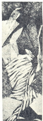
Բեն Խոջեանի գրքերի շարքից