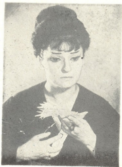
დედა — ე. გუგუშვილის „წეროვანი“.