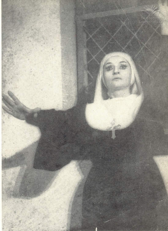
ვირჯინია — „გალილეო გალილეი“.