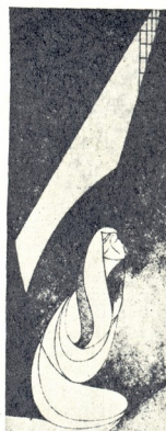
Բեն Խոջեանի գրքերի շարքից