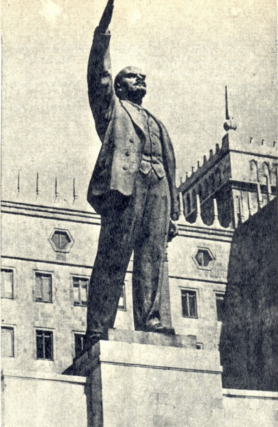
ბაქო. ვ. ი. ლენინის ძეგლი მოყვობის სახელობა წინ.