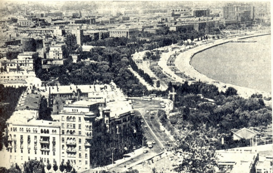
ბაქო. სანაპირო პარკისა და მენავთობეთა პროსპექტის ხედი კიროვის სახელობის პარკიდან.