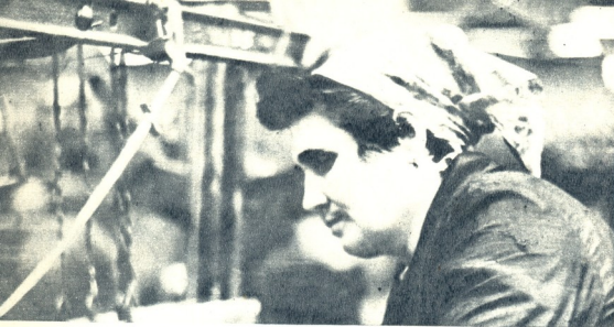
მაღეკამულის კომბინატი, ნოზამი.