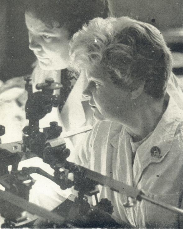
მედიცინის მასწავლებელი ლომიძისა ი. ზავთაძისა და მ. მორავის.