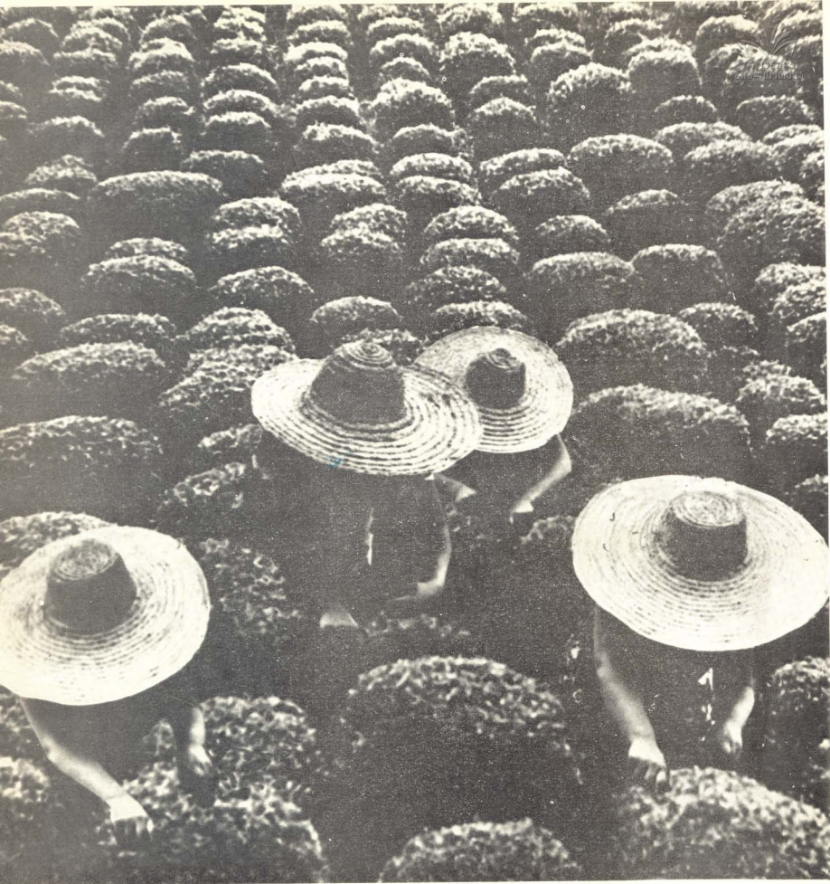
ნანს ალანბაძიაში