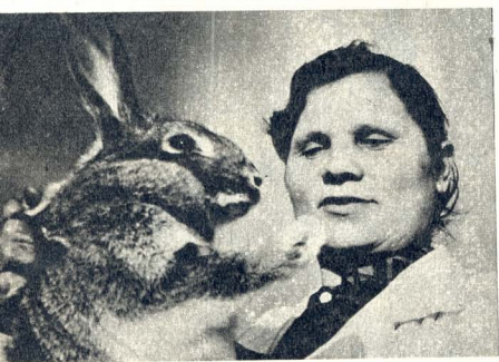
მეყრდღლე 6. კატარია