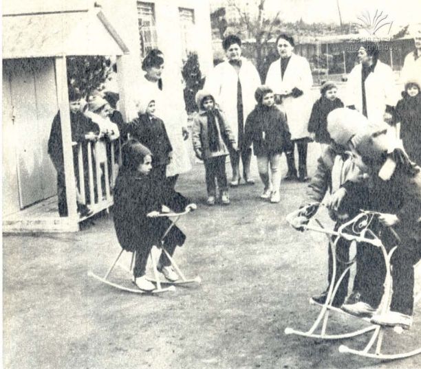
ვეტერან ქალთა სექციის წევრები დიმიტროვის სახელობის ქარხნის საბავშვო მიწაზე

წლებიდან, 1973 წელს მნიშვნელოვანი და პასუხისმგებელი ამოცანები დადგინდა. შეიძლება იყოს ჩვენს მარტოხელთა მომხმარებელი ომ დღის საზოგადოებრივი ძვირბირების, რაც პასუხად მოკავს სექციონერული კომიტეტის დადგენილებას თბილისის პარტიული ორგანიზაციის შემოხმობის