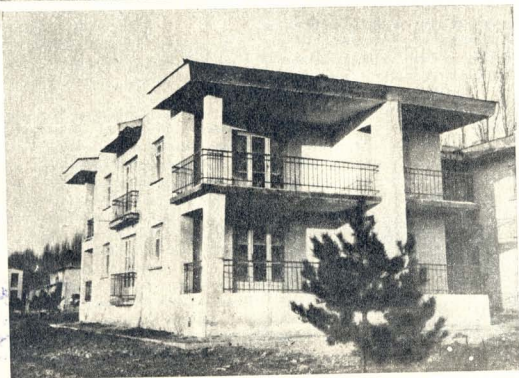
მუშაო საცხოვრებელი სახლი