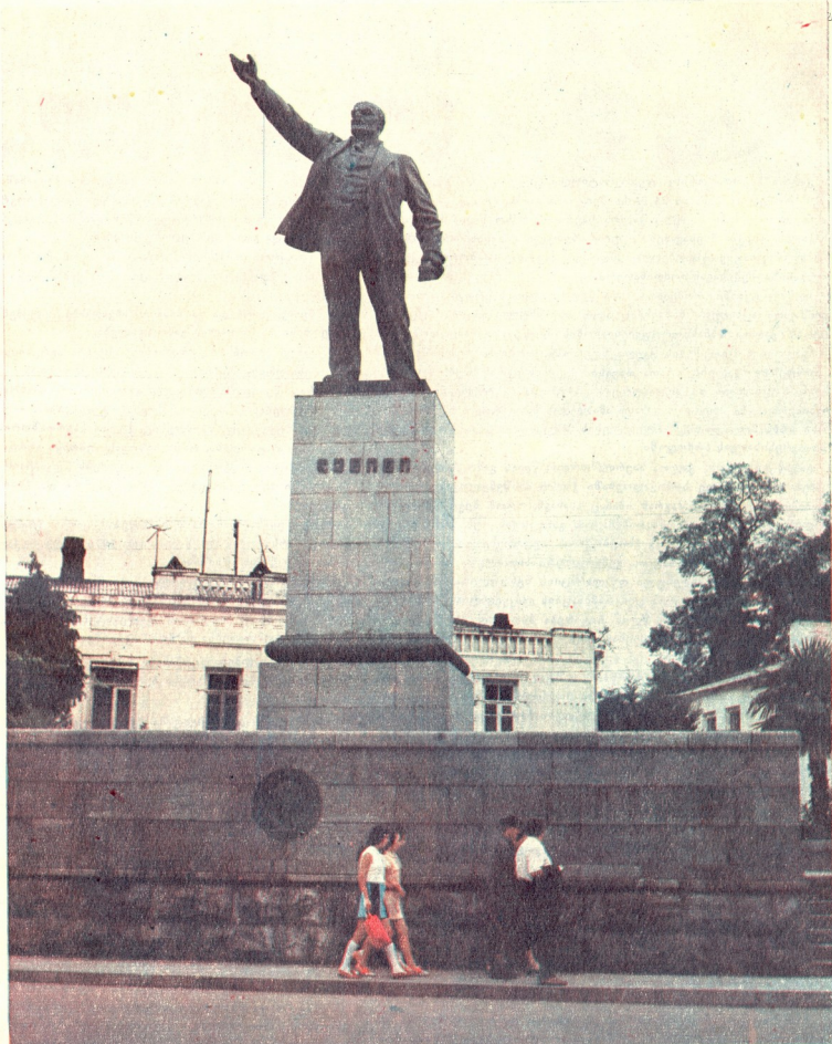
3. ი. ლენინის ძეგლი ბათუმში

ქ. შარტავა ხან. საქ. სს. საგეოგრაფიო რესპუბლიკა გეოგრაფიული