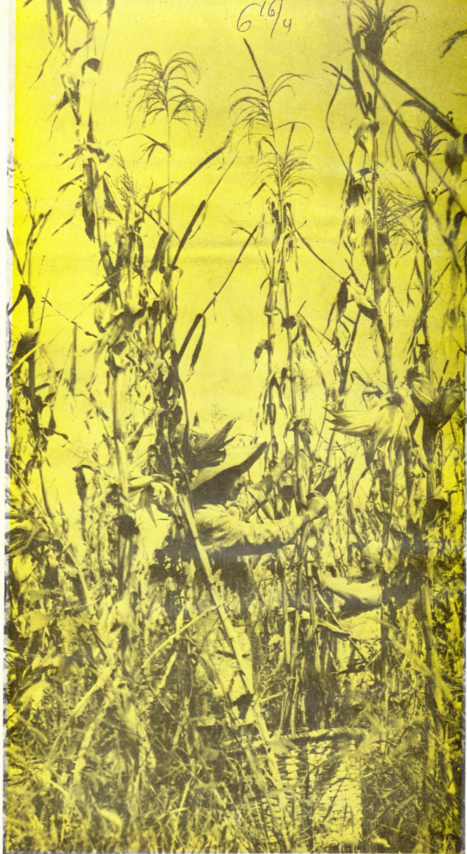
ამაშის ლაიონის სოფელ ნაროს სტა- ლინის სახელობის კოლმეურნეობის კანონი წილს ჰეიფაზე იმ ცენტრში სიმონი პლანს და მეთავე გალაქიძის ვალდებულებას.