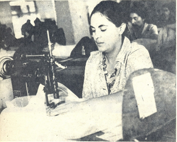
ბრიგადის წევრი მუშაკი

მაგამ ეველაზე ლამაზი ოცნებანი ლაზე-ნათელი მიზანი აუხდენელი დარება, თუ თითოეულმა ცილ-ცალკე და ეველამ ერთად არ გაიღო თავისი წვლილი. იცინა, ყარაღ იციან ეს ეველანამ და მისმა მეგობრებმა, და ამიტომ წუთითაც არ იგვიანებენ სამუშაოზე, არ ტოვებენ მოუღელს საჭარავ მანქანებს, არ შეპყვებიან მასლაის მესენერებაზე, ზეალისთვის არ გადაღებენ დღის ვასკეთებელს.