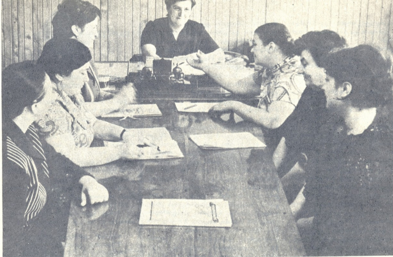
რესპუბლიკის ქალთა საკვანძო