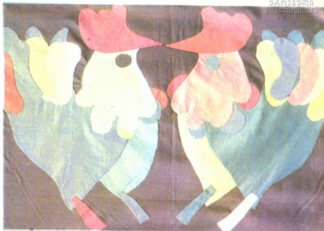
მანანა თავაძის ნამუშევრები