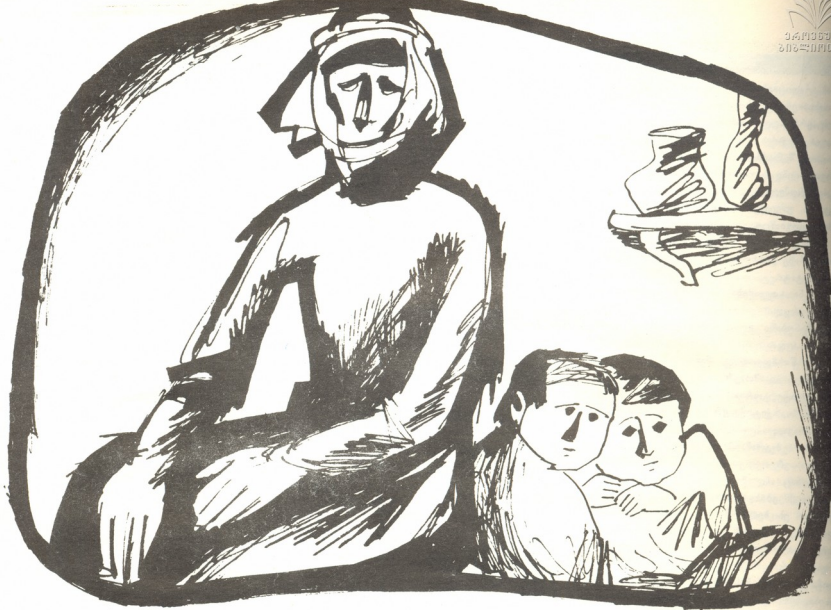
მხატვარი ნანა შალიკაშვილი