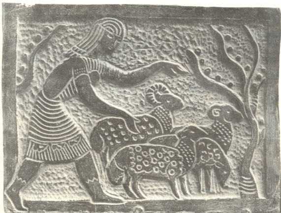
გუგა მიქაძის ნამუშევრები

მხატვარი ოსტატურად აგებს კომპოზიციებს. სხვადასხვა ზომის გამობუნებები ხაზოვანობით იძლევა ხაზი გაყვას არსებით, ძირითადს და ამით გაყოცხლდეს თბრობითი ელემენტებიც. გუგა მიქაძის მანერისათვის დამახასიათებელი ხაზგასმული ექსპრესია და დეტრაციულია ერთგვარი გამოსახილია