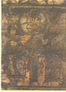
დ. იაკობაშვილის ფერადი რეპროდუქციები