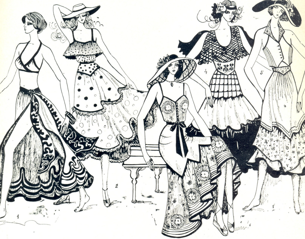
მოდულების ავტორი ნანა ცეკიტაია