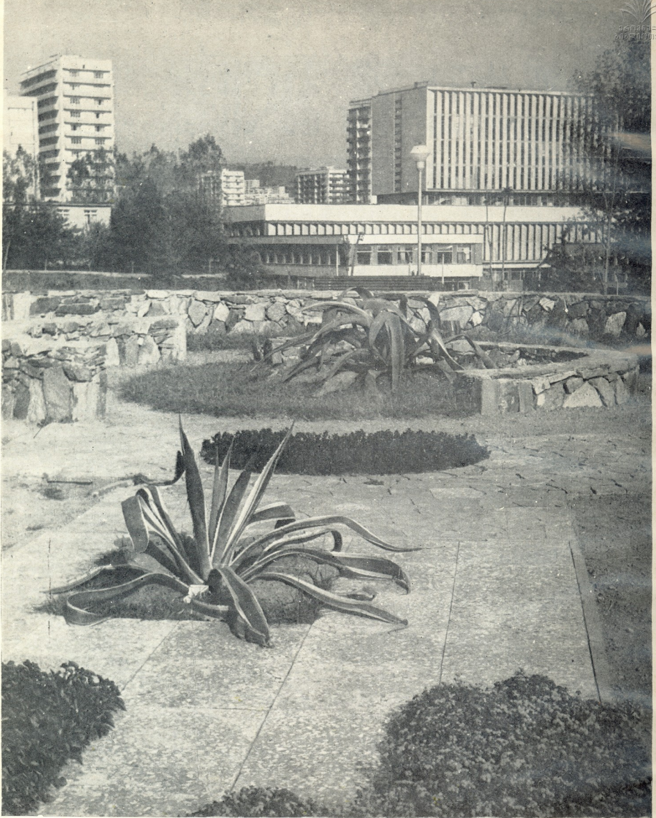
დიდის შასავი.