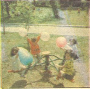
დ. იაკობაშვილის ფერადი სლაიდები