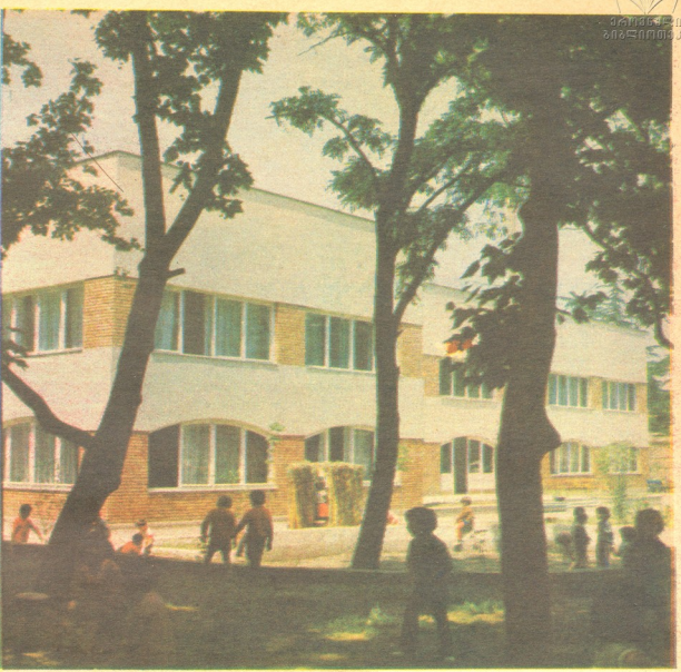
ატარებმა დიდებული საჩუქარი მიიღეს. დიდებუნი, წერილის გამორჩეულ ყურადღებას იპყრობს თბილისის მაულ-კავოლის კომპინანტის ახალი ბავა-ბალი „ზორი“.

...ღილით ისე დაიწყება ჩვეულებრივი დღე, ადამიანის სიცოცხლის გადარჩენის სილაშხითი საყსე დღე რომ ჰქვია.