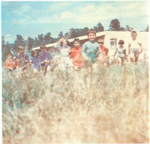
თბილისის ორჩინიძის სახელობის სამკერვალო ფაბრიკის საგა-ბაღის ალსაზრდელთა მანგლისში

ჯანმრთელობის დაცვის სამინისტროს 276 საბავშვო ბაღის 7206 ბავშვიდან (თბილისიდან 4 საბავშვო ბაღის, ფოთიდან — 2, წყალტუბოიდან — 1) 236 გაიყვანეს შარშან ახალდაბაში, წალეგრა და გარდში. წლეულს კი თბილისის ნაქრები საბავშვო ბაგებიდან მხოლოდ 100-ის გაყვანა მოხერხდა. თუ შარშან საქართველოს კვების მრეწველობის სამინისტროს სისტემის სკოლამდელი აღზრდის დაწესებულების აღსაზრდელთა 37 პროცენტზე იყო აგარაკზე (ცხადია, ნაქირავე ბინებში), წლეულს მხოლოდ 34 პროცენტის ნაყვანა მოხერხდა. განათლების სამინისტროს 1203 სკოლამდელი აღზრდის კერის 113563 აღსაზრდელიდან კურორტზე დაასვენეს — 7151.