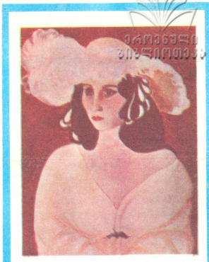
ანრი მატისი — „თეთრი ბუმბულაში“

საქართველოს ხელოვნების მუზეუმი გამართულ იმპრესიონისტებისა და პოსტიმპრესიონისტების ნამუშევრებს დიდი ინტერესით გაეცნო 2001 ათასი თბილისელი და რესპუბლიკის დედაქალაქის სტუმარი. თვენახევრის განმავლობაში იყო ექსპონირებული მანუან მატისამდე — 20 ავტორის 54 ნაწარმოები.