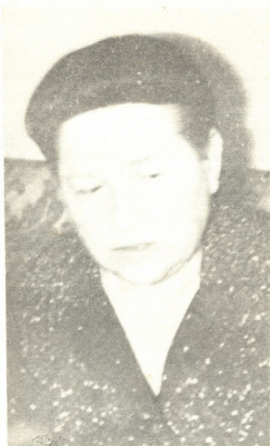
თამარ ლაშარაშვილი — საქართველოს სსრ უმაღლესი საბჭოს პრეზიდიუმის მდივანი;

— რედაქციამ გონივრული ღონისძიება ითავა. აქ ბევრი ითქვა ჩვენი ტრადიციების ავკარგზე. მე კიდევ ერთხელ მინდა ხაზი გავუსვა, რომ ძველ კარგ ტრადიციებს საოული მოყვრება და გაფრთხილება ესაჭიროება, მანკიერსა და წრეგადასულს კი — დაგმოხა. თუ გვირდა, რომ ამ შეხვედრამ გარკვეული შედეგი გამოიღოს, ტემში არ უნდა შევანელით, პირიქით, მიუღი დასაშრობა, მიუღი მოძრაობა უნდა გამოვაცხადოთ. ამ ბრძოლაში დიდი როლი შეიძლება შეასრულოს ხოცილოლებსა და ეთნოგრაფების გამოცემა პრესაში და ტელეეკრანზე.