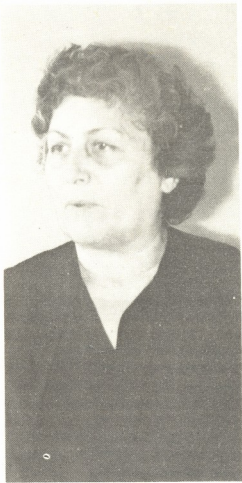
ვერა ქავაშვილი — სოციალისტური შრომის გმირი, სკკპ ცენტრალური სარევიზიო კომისიის წევრი:

— დიდი ხანი არ არის, რაც დედა გარდაემცვალა, პურმარილიანი ქალი იყო ის მაღლიანი. ბოლო დროს ბევრს ავადმყოფობდა. მნახველი, რომ კარს შემოაღებოდა, თვალთი მანიშნებდა, არ გაუშვა, პური აჭამეო. ალბათ, გამიგებთ რა ძნელი იყო ჩემთვის მრავალსულთან ქელვებზე უარის თქმა. მაგრამ, ერთი წუთითაც არ დავეჭირებულვარ. აბა, ვინ უნდა იყოს მაგალითის მიმცემი, თუ არა მე! ნამდვილად აღმშობილებული ვარ იმით, რაც დღეს ჩვენს ქალაქში ხდება: ქორწინლებსა და ქელვებებს პირდაპირ ეზოებში მართავენ. გვიარ ღამემდე არ წყდება ხმაური და ღრიანიცელი. სხვა თუ არაფერი, იმას მაინც უნდა მოვერდოთ, რომ თანამედროვე მჭიდროდ დასახლებულ ბინებში მანერებს ძიღს ვუფრთხოთ.