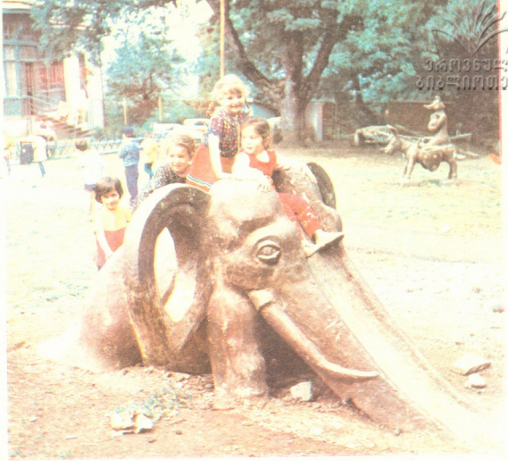
საქართველოს სსრ განათლების სამინისტროს მე-18 საბავშვო ბაღის ალსაზრდელთა ზაფხული კოჩორში გაატარეს.