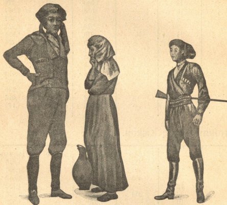
Les Lases (les Géorgiens-Musulmans).

D'après le « The Statesman's Year book » 1,265,000. Ce nombre comprend 88,436 non-musulmans (Grecs et Arméniens) et