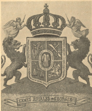
L'armoire des Bagratons.

Elles sont ensuite transportées par les routes de caravanes jusqu'en Perse où ces marchandises supplantent facilement celles qui parviennent des régions de Moscou. Cela s'explique par le fait que les marchandises allemandes sont vendues à très bon marché et transportées par voie maritime, et que le commerce en est facilité et encouragé par des primes d'exportation instituées par l'Allemagne pour les produits manufacturés nationaux destinés à être