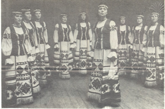
ფეხსაცმლის ფაბრიკის კოლექტივი მსახვნი.

პროცენტზე მეტს ქალები შეადგენენ. მეცნიერებასა, ტექნიკასა და კულტურაში შეტანილი დიდი ღვაწლისათვის სამთავის ხუთას ქალზე მეტს რესპუბლიკის საპატიო ნიშნები აქვს მინიჭებული.