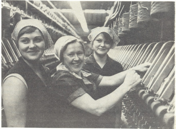
მონკავე მკანალო (დებარმა) თაჟა შეჯიბრებაში.

დედის პირველსახედ იქცა ხოდინოს ყოფილი მცხერები ანასტასია კუპრიანოვა, როლის ხუთმა ვაჟმა, მათ შორის სამაქათა კავშირის გმირმა პეტრე კუპრიანოვმა სიცოცხლე შესწირა ფაშიზმის წინააღმდეგ ბრძოლას. ეს ძეგლი სიმბოლურად გამოხატავს დედის მშვენიერ, კეთილშობილურ და ქაშმარტად სვეტსახეს, მისი სულის სიღამაზესა და სიღადავს.