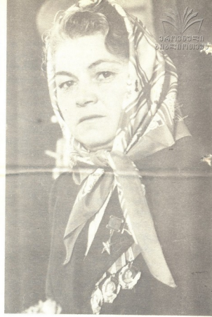
სოციალისტური შრომის გმირი მარია გიმელე

თი წაღლის დონე არც მეფროსმეტე ზუო წლდის პირველ წელს ჩამოუყვითებიაო. 1981 წლის სსრკ კავშირის სახელმწიფო პრემია შრომაში თვალსაჩინო მიღწევებო-სათვის მიენიჭა ორ ჰევის მშრომელ ქალს - კიშინიოვის პურპაროდუქტების კომბინა-ტის მებურღულესი ლ მიაგარუსკ და ოქნი-ციას რაიონის კოლმურჩეობა „პრავედს“- მანქანური წველის ოპერატორს გ კურას მეფროსმეტე ზუთწელისის მესამე წლის და-ვადებობა შესრულდება ამთავრებს ვ. ოდ-ობესკუე - სოციალისტური შრომის გმირი, ღებსაცელის გაერთიანება „ზორილესს“ გა-მიპყრეული.