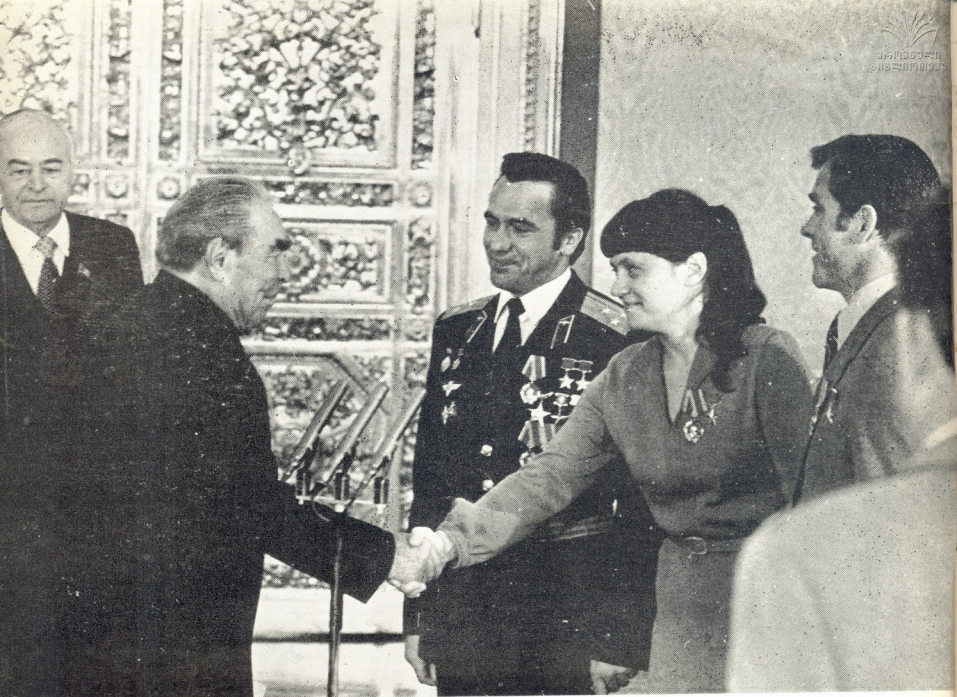
„ჯილდომიანი გზადავანის ღროს“ საქვებს საქინფორმის ტელეფონი.