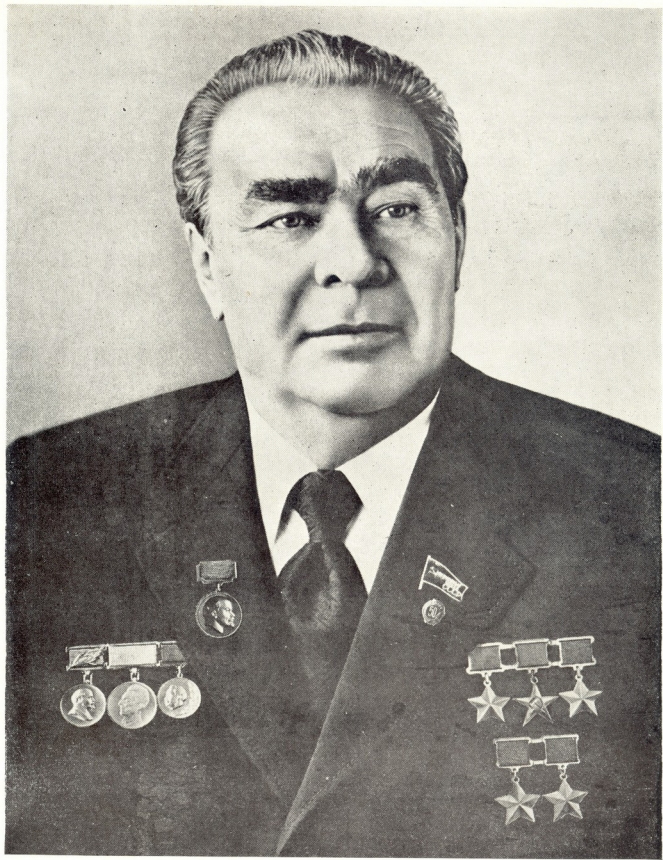
ლეონიდ ილიას ძე ბრეჟნევი