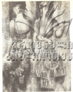
ზურაბ ნიჟარაძე — „ღვ იყვება“

სახელგანი ფერმწერი, საქართველოს სახალხო მხატვარი ზურაბ ნიჟარაძე ქართული ფუნჯის ოსტატია იმ თაობის წარმომადგენელია, რომელიც 20-იანი წლების მეორე ნახევარში საკუთარი თემატიკით, საშუალოს თავისებური სტადიით მოვიდა ხაზით ხელვნებაში და ტრადიული ფერწერის გავითარების ახალი გზების ძიებით წარმართა თავისი შემოქმედება.