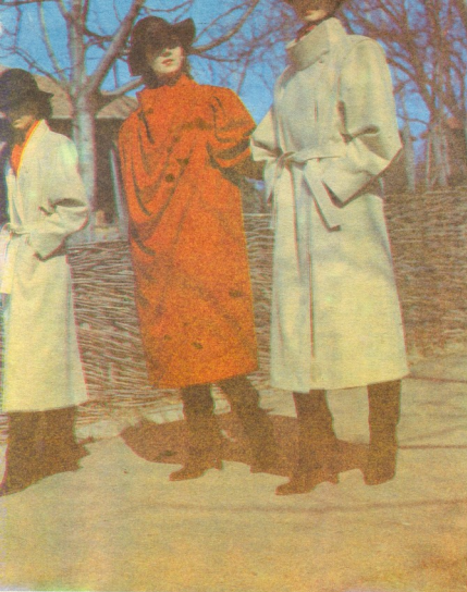
საბრტყელს სსრ საუნთქავი მომსახურების სამინისტროს მუდღეობის სასლში