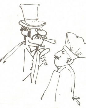
გერმანულიდან თარგმნა შ. ამირანაშვილი