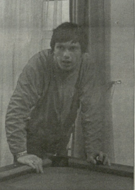
ახლანდელი კოორდინატორი ფიჭო