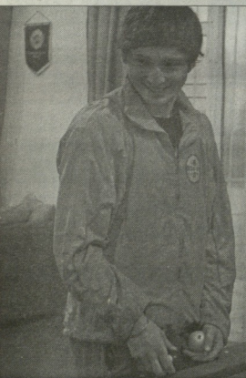
გაბელის მწვანეები დაიხვედნენ დროს ბოლიანოვი ერკობიძის