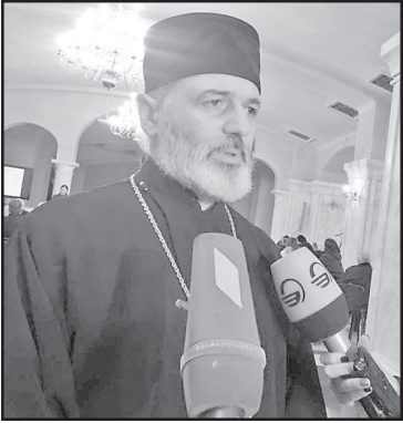
საპატრიარქოს ოფიციალური პოზიციაა, რომ ეკლესია წინასაარჩევნო პროცესებში არ ერევა.