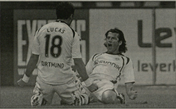
წელს ვალესი და ლუკას ბარიოსი ფორტუნაში ერთად თამაშებენ და დიე მანსია, რომ პარაგვაის ნაკრებზე ერთად იასპარეზონ