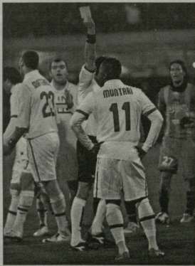
კატანორი მარცხის შემდეგ ინტერმა მილანი ერთ ქულაზე დაიახლოვა