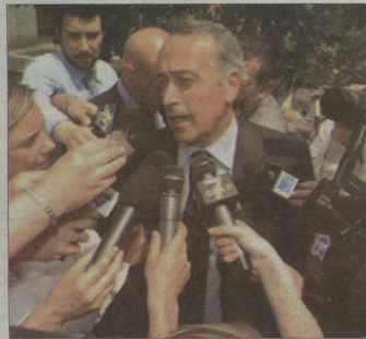
ჯანკარლო აბეტე მიიხვეს, რომ კალჩიოლის სკანდალი არ ამირტრულა