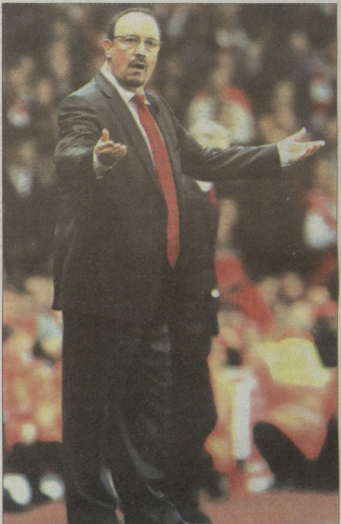
მეც რას მითხრო? რაზე ბენიჩის მიზნებს, რომ ამ ლიბიაში შესაძლებლობა აიძვრება

აქვე აღსანიშნავია, რომ "ლიბიაში" ახალი ინტელის ცენტრები უნდა დაიწყოს. კომპანია Rhone Group , "ნოთის" კვლევა 100 მილიონის ჩაგება აპირებდა, მაგრამ ახლა უკვე ის ჩანს, რომ ამ საქმეში აღარაფერი გამოვი. ბენიჩისმა თქვა: