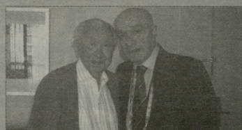
ანგონიო, 2010 წლის ობერველი - ხუან ანგონიო სპარაერი და სკოლის პირველი ვივე პირხივენი რამაზ გოლდერი ნიღარ ქუბარტყილაძის გარდაცვალების გამო მწხარეობის განსაზარებლად სპარაერი საქართველოს მდღეუბიას ეწვია, სახმებაროდ, უკანასკნელად

საქართველოს ეროვნული ოლიმპიორი კომიტეტი ღრმა მწხარეობით იუხევა, რომ გარდაიცვალა საგრაზიორის ოლიმპიორი კომიტეტის სპარტო პრეზიდენტი, თანამედროვე ოლიმპიორი მოძრაობის არმბეტქორი, უფიცილი დიპლომატი, ჩეხი ქვეყნის, ქართული სპორტის ვულუმბეტქორი და საქართველოს ეროვნული ოლიმპიორი კომიტეტის ერთხელ მეგობარი, მკერეზი