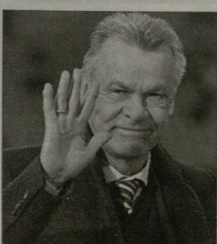
შვეიცარიის ნაკრების მთავარი მწვრთნელი...