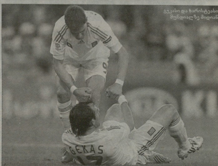
გასკის და ხარისტისი მუნიციპალიტეტი...