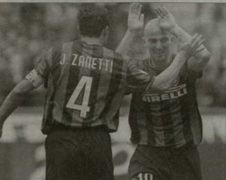
მარკალონა მანტისა და კამბოსოზე უარი თქვა