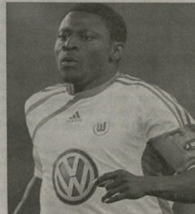
ნორვეგიის ერთ-ერთი იმედი...