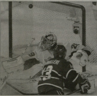
ლაველიას „უკუ პირველი პერიოდის მე-10 ნოუთისთვის გასაძლიერებელი გუნდები გამარჯვებულნი.

სამხალისე თაისი მოქმედი ჩემპიონი „პიტსბურგ პინგპონტი“ სერვისის წინაშე დგება. „პინგპონტი“ არ დაემაყოფილა პირველი წრედი რეგულარული ჩემპიონატის კვალით გუნდის - „კამინგტონ კიტსბურგ“ გადგებით და ახლა „პინგპონტი“ გუნდებში... ამ გუნდის სერვისი ანგარიში - 3:2 გახდა. „პინგპონტი“ მომხრე უსამართლო მეტსახელი - „პილი“ ფიგურის გამოყოფილი კლუბი „როგორც ჩანს, კანადელი არამარტო რეგულარული ჩემპიონები, არამედ საათის დამამუშებელი ძლიერი არიან. ასე მაგალითად, „პიტსბურგ“ „კამინგტონთან“ პირველადი აქვს თამაში რე-შემაგდებისას გასაძლიერებელი გუნდის რაოდენობით - 5:1.