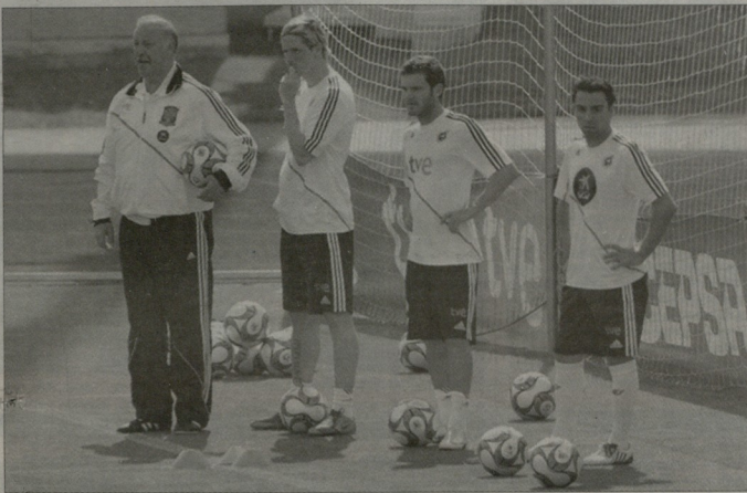
დედ ბოსკან (მარცხნივ) ტორის (მარცხნივ) მეორე სურვა

11 მაისს მსოფლიოს ჩემპიონატის მიზანმიმართულ 32-ეე ნაკრებს თავიკვს ფიკა-ში უნდვს 30-კაციანი სია გავა-ზუნა, რომელიც იქნის 23-23 ფეხბურთელი დარბებს. შუამდგენლობა დასახელა მსოფლიოს ჩემპიონატის ერთ-ერთი ფავორიტი, ესპანეთის ნაკრებს შიკავინა მწერთიწლებს მიწდებულ ბოსკან. მთლი, ჯერ შემადგენლობას გაავსებენ.