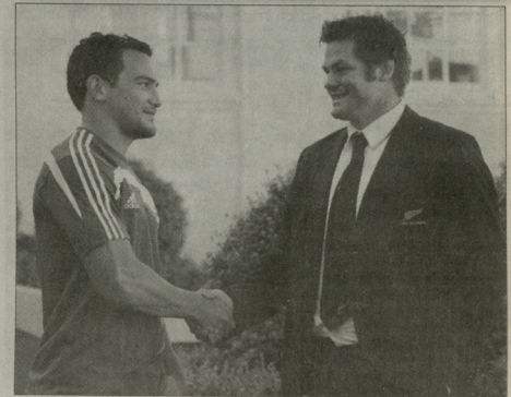
ბუნებრივი და ორი მკაცრი