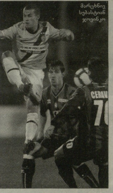
მარკსინი სესაიანი გურგული

მიუხედავად იმისა, რომ პოშიმ დროის დახმავებით ნიკოლა საბავარიც სერბი გააძრავა, კლუბის მესამე ტურში მანდრის დადებითი მთავრებლობა დაეხდა. ის მიერე ერთი, რომელიც მანდრის დიდ ნერბი მისცა, ბოლომდე გამოყენება და მეტოფორი რეპეტიცია დაეხდა. ანგარიშს კასარეს ტრანსფერისთვის, დროებით ძირითადში იმარჯობდა