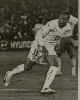
დღის ფორლანი მთავრად ტურის ერთ-ერთი გამორჩეული ფიგურა იყო