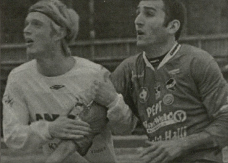
მარჯვენე ირავლი სირბირი

სირბირის ჩემპიონატის მე-12 ტურში საქართველო აულისმ სტუმრად 3:1 დამარცხდა „ლიოსს“, სტუმრისა სმი გოლიდან ირავლი კარგულია მგარჯობა - 45-ე წუთზე 29 წლის გორგი ერასოვიძე 2:0 განაბა ანდრეისი, ხოლო 86-ე წუთზე 25 წლის შოთა ვეჯინა „ლიოსს“ მესამე გოლი გაიტანა. ორივესთვის კარგული გოლი ჩემპიონატში, ერასოვიძეს და იმდენი უფერულობაზე 90-90 წუთი თამაშზე, გოლის ავტორი ჯეიკია კი 74-ე წუთზე გაგა თბილამვი-