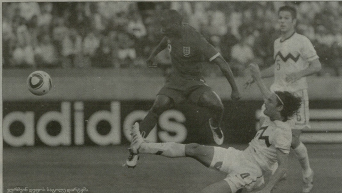
ვერსის დევისი საცალო დარგმა