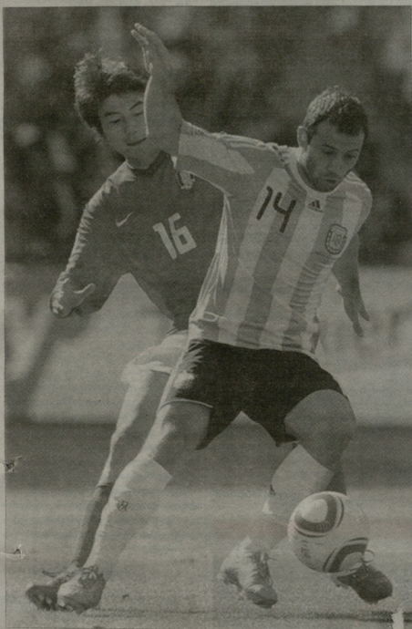
ხავერდ მასკერანო კორეველებთან მატჩში