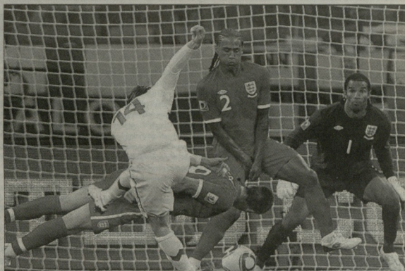
ბურის ჯონ ტერი გადაღება