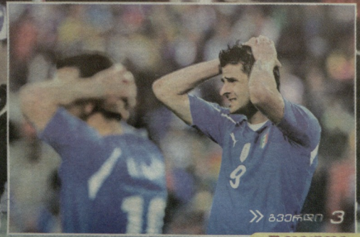
» გვერდი 3