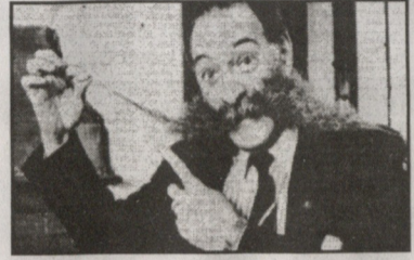
№ 3 სურათზე არიან ყველაზე მაღალი კრის გრინერი 229 სმ. სიმაღლის (ბრიტანეთი) და ჯონ როი, ყველაზე გრძელი ულვაშის მამაკაცი (ბრიტანეთი) 189 სმ. ერთხელ ტუ-