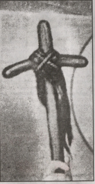
ახლა მონამეთას მონასტერია: VIII ს. პირველი ნახევარი. კონსტანტი კახი. ქართველი ერისთავი. იბრძოდა ბულა თუ- რქის წინააღმდეგ. ქრისტიანული

წმინდა საგზებელი, რისთვისაც მარზპანის ბრძანებით ჩაქოლეს. დასაფლავე- ბულია სამთავროში (მცხეთა), VI საუკუნის დამლევით. აბო თბილელი. არაბი. ქა- რთლის ერისთავის ნერსეს მსა- ხური. ნერსეს გაპყვა ხაზარეთში და მიიღო ქრისტიანობა. არაბე- ბმა მოსთხოვეს გამაჰმადიანება, მა- გრამ უარყო, თავი მოკვეთეს თბი- ლისში. 786 წ. არჩილ სტეფანოზის ძე. ქა- რთლის ერისთავი. ჯუანშერის მათიანეში იჯსენიება მეფედ. იძუ- ლებით მოუნათლავს ნუსხატელები. არ მიიღო არაბთა დიდება და პატივი, არ უარყო ქრისტეს რჯული და წამებით მოკლეს. VIII ს. დავით და კონსტანტინე. არგვე- თის მთავრები მხედრთა გვარო- დან. გამორულად ებრძოდნენ მუ- რვან ყრუს. არაბებმა მონაგებრივი სიკვდილით დასაჯეს, ქართველე- ბმა მათი გვამები დაკრძალეს მდ. წყალწითელას ნაპირზე, სადაც