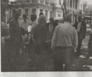
პლენარის წარმართვის დასრულება. რკინიგზაზე სანახაუდ. დიპლომატიური ნიშნა, დიპლომატიური ნიშნა, დიპლომატიური ნიშნა

ნიდან გაისმა რევან ლადიძის „ჩემო კარგო ქვეყანა“. კვლავ ვგრძენი ის რაღაც განსაკუთრებული, ენით გამოუთქმელი, ჩემი გულის სიდრემეში მიმა-