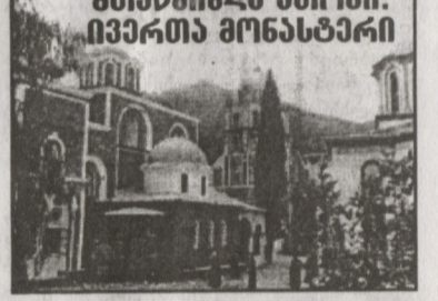
მთაწმინდა ათონი. ივერთა მონასტერი ზრდობელია და ყველა სიკეთე და სი- ავე, რასაც გონება ხედავს, გულში ჩა- ლის. გული კი ცენტრია ადამიანის სუ- ლიერი და ზორციელი ძალებისა. იგივე ბერი ამბობდა: „როცა გონება იწმინდება და ნათლდება საკუთარი სი- ნათლით ღვთის მადლის დაუხმარებლად, მაშინ ის, დამატებით, ღვთის მადლის ნათლსაც მიიღებს: და ეს მადლი შე- იძლება მუდმივად დარჩეს გონებაში და გააძლიეროს მისი შექმნებისა და ხე- დვის უნარი, როგორც და რა ძალით - ეს მადლმა უწიეს. მაგრამ ადამიანსაც, როცა სურს მისთვის საინტერესო რამ დაინახოს, ან შეიმეცნოს. შეუძლია ამის შესახებ ლოცვაში ითხოვოს, და მაშინ ამოქმედდება მადლი და დააკმაყოფილებს მის თხოვნას.“ V აზრები ბერი იოსები გვირჩევდა: „უწინარე- ხად, ეშმაკი ცდილობს გონებაში ცუდი აზრები ჩაგთესოს, არ დააყოფო, ლო- ცვით გააცამტკერე.“ ბერი იოსები თავის სულიერ შვილს სწერდა: „უფრთხილი ბიროტ აზრებს, როგორც ცეცხლს. წამითაც ნუ შეანე- რებს მთზე უფარადებას, რათა ფესვი არ გაიფაროს შენში. გულს ნუ გაიტაცებ, ღმერთი დღობს და მოიტივებს ცო- ლეებს. როცა ცოდავს ჩაიღვენ, მოინანიე და იმზე იფიქრე, ხელმოკრულ არ ჩა- იდინო იგივე ცოდავ.“ VI დემოლი ბერი იოსები თავის სულიერ შვილს უბნობდა უდაბნოში და სწერდა: „ჩემო საყვარლო შვილო. ახლა ჩამოდი, ერთი დღით მაინც, ვისაუბროთ ღმერთზე და ღვთისმეტყველებაზე. ჩამოდი და დატყბი იმით, რაც ეგზომ მოგნატრებია. მო- უსმინე ფრიალო კლდეებს, ამ იღუმე- ლებით მოკულ, მღუმარ ღვთისმეტყველო, რათა მათ გამეცნონ ღრმა იდეები და უწინ გონება მიყვანო შემოქმედთან. შეგიღვრის ღვთისმეტყველები: დიდებული კლდეები და მთელი ბუნება, თითოეული თავის ხმით და თავის სიწმიდით. პატარა ბაღებს რომ ხელი შეახო, თავისი სუ- რენლების ფრქვევით წამოიყვირობს: „ოჰ, ნუთუ ვერ დამინახე? როგორ მატყი- ნეს“. აქ ყველაფერს თავის ხმა აქვს და მაცოცხლებელ ნიათთან ერთად, რომე- ლსაც ყოველივე მოძრაობაში მოქცავს: პარმონიული და მუსიკალური ქება-დი- დება ადევლინება ღმერთს. ეჰ, რამდენი რამე შემიძლია ვთქვათ ქვეყნარაგულსა და ფრინველებზე...“

ენერგიით მოქმედებს: ერთის მხრივ იმის რწმენით, ვინც მოვალებს დააკისრა, მეორეს მხრივ - თვით მსახურების სი- ვეარულით!“ III ლოცვა ბერი იოსები ამბობდა: „წმიდა ლო- ცვისკენ მიმავალი გზა ვნებებთან ბრძო- ლით იწყება, ვიდრე ვნებები ბოლოქრო- ბენ, ლოცვაში წარმატებას ვერ მიაღწე- ვ. მაგრამ ისინი ვერ შეაფერხებდნენ ლო- ცვის მადლის მოსვლას, უსულგულობა და პატივმოყვარეობა არ ეღობოდეს წინ.“ დემონები ღვთისმსახურთა წინა- აღმდეგ სასტიკი ომს აწარმოებენ. ლო- ცვით ხდება მათი მოკვრება და თა- ნდათნობით დაუძლეურება. ბერი იოსები წერდა: „ვინმე რომ გვერდით მყოფოდა, გაიგებდა ჩემს ლოცვას და ოხვრას. დაინახავდა ჩემს ცრემლსაც, რომელსაც ჩემი ძმებისთვის ვღვრი. მთელი დამე ვლოცულობ და ვვედრები უფალს: „ღმე- რთო, ან ყველა ძმა იხსენ, ან მეც დამღუპე, მე მარტო არ მინდა სამო- თხე.“ ბერი იოსები ამბობდა: „როცა გო- ნება მიიღებს ლოცვას და ადამიანი სი- ხარულს იგრძნობს, მაშინ ლოცვა მასში