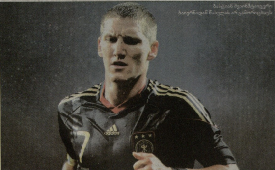
მიხაელ შვაინშტაივერი ბაიერნიდან წასვლის არ გამოიყურება