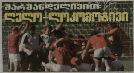
რაბი. თასის ფინალის წინათქმა » გვერდი 13

14 ივლისი ოთხშაბათი 2010 № 163 (13151) ფასი 60 თეთრი