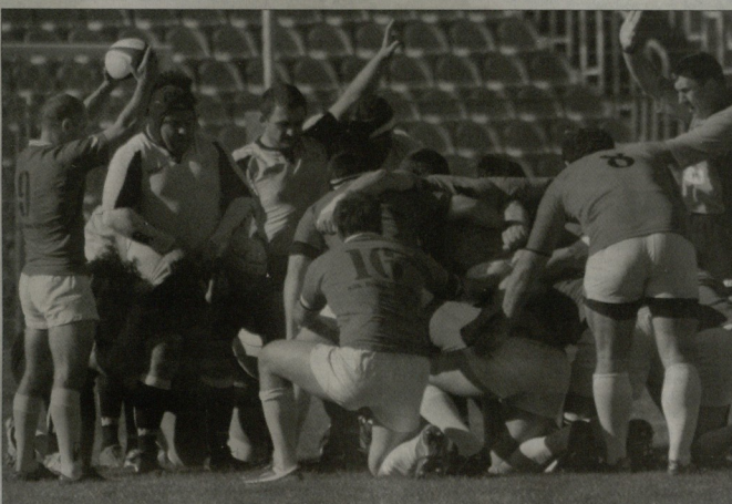
ფის გილებზე დასიქობადია. პირველ მატჩში სტუმრად, ვანში თბილისელმა მორახტებმა 25:21 მოივის. ნახევარეგინობაში კი 19:12 გათოხრევის.