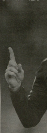
სერვის რამის საუკეთესო