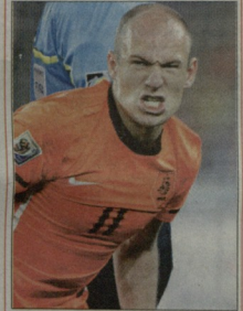
ივლისის ბაზო » გვერდი 11