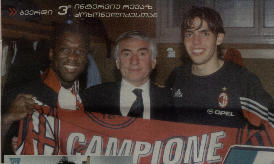
» გვერდი 3 ინტერვიუ რეჟისორს კოსტოლიჩესთან