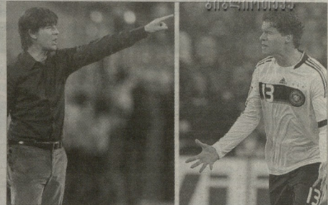
ნაირამეს ოაზის ლიონი მიხედა ბალას კაპიტანს სამკლავურს?