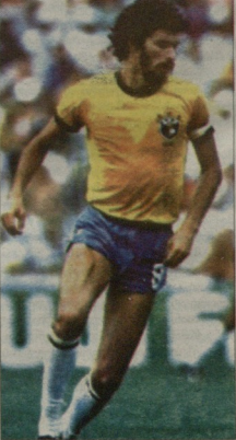
მსახივანე კაპიჯანი მსახივანე ვუღებდა ერთად მუშაობალი ვერ მოიკო