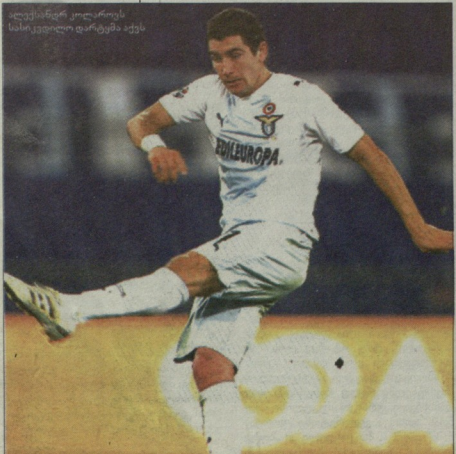
კოლაროვი კოლაროვის სასი კვიჩიპალია ვაკვლი

მისხსენებამი, მანქანების სიბრ- ლეისკან“ 17 მილიონ ფუნტად ანუ 20,3 მილიონ ევროდ სერს მკველი ალექსანდრე კოლაროვი იყიდა და ინგ- ლისარი პრემიერ ლიგის მუშაობაზე მანჩინი რა თქვებები არის ეს 24 წლის ბულგარელი ზომი დაჯილდოებული? ვაკვლი, რომ ფეხბურთელისთვის სა- ჭირო ბუკერ სასარგებლო თვისებებსა- ნ ერთად ის ერთი რამივად ვახლავთ გა- მორჩეული: იანისითი არის - ლეგენ- დარული ქართველი ფულბის „პირველი მუშაობის“ მთავარი გმირზე მოვახსენ- ებთ - მტერს მიხედავ მისი დარტყმე- ბი. ვისაც არ სჯერა, იტალიელ მსახივებს და მის როლებს თანდავხე- ლებს ჰქობისთვის, ნურც ბრძანული ვა- ზებობი და არბიტრ მანჩინილიან სკავინს ასახელებენ. ამ მსახივ 2009 წლის მანქანების სიბრძნის დარტყ- მის გამომწვევით ნურითი ვინცება და- კარგა - იმ დღეს „ლაიკო“ „ტრონიოს“ თამაშებულა. ვამბობ და ამჟამად 9 თვე და უკროდ დანერგება მინახე ნა- ბოლის“ ფეხბურთელი ვსკლავ ლავი- დი - მინეზი იტყვი, კოლაროვი მორ დარ- ტყმული ბურთი ვერ აიკვინა.