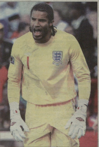
დევიდ ვეიხის ნაკრებიდან ისახლავს ვერ არ ფორმის