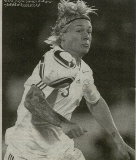
სიმონი კვრანის უფიცილი მომავალი უზინსაწარმოებდა

„რბალი მის ქვეყანა, სადაც კიარნი ნიქურე ფეხბურთელმა ჩამოაყალიბებულ...“