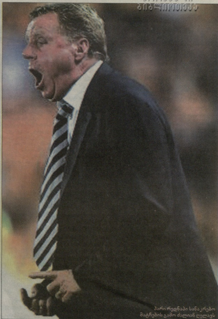
პარი რედნაკი სანაკრებო მატჩების გამო ძალიან ეღვინა

„ფეხბურთის ასოციაციამ ფაბიოს პუკიას, საფრანგეთში 19-წლამდელი ვეროის ჩემპიონატზე ჩასვლა ზომ არ ვინდაო, მან კი უარი შეუთვალა, რადგან არ უნდოდა ვაკუებობა რამე მხოლოდ იმიტომ, რომ ეს ფეხბურთის ასოციაციასი თავიკაცს მოუპოვია. 21-წლამდელთა ნაკრები რომ ყოფილიყო, კაპელის შესასვლა თავი ვადდებულად ეკრწნი და შეუებრებაზე გამეჯერებულყო, 19 და 18 წლის ბიჭების ნახვი კი მისი მხრიადა და მოლოდინი „პიარი“ იქნებოდა და ეს არ ინდობა. ფაბიომ კარვად იცის, რომ როდესაც კაცი ინგლისის ნაკრების მწვინელის თამაშს ინგლისს, მზად უნდა იყოს, რომ კვლავ ვარიანტში გააკრიტიკებენ. ინგლისის ნაკრების მწვინელი ვერისდროს ვერაფერს ვაკუებებს ისე, რომ არ გალანდნოს. ეს პროფესიის შემადგენელი ნაწილია. რაც შეეხება 19 წლამდელ უნერეთს ფეხბურთელებს, თუ ისინი იმდენად ძლიერები არიან, რომ უკვე ლირს მათი დიდ ნაკრებში მიიღევა, ესე იგი მწვერვლია, თეიანითი კლუბების შემადგენლობაში გამოიღდება. ასე რომ, მათი საწახაად შეუებრების შეუხვევა და საფრანგეთში გამეჯერება აუცილებელი სულაც არ იყო. ნინააღმდეგ შეხმეხვევაში კი ნაკრების ხელმძღვანელებს მათი გვარების მხოლოდ და მხოლოდ ჩამბენა და შემდგომი წლის განმელობაში მათზე დაკვირვება მართებო - საქართველო“.