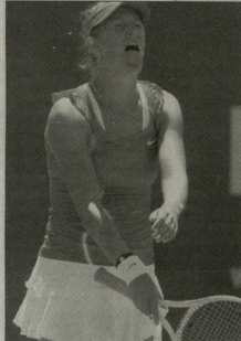
სტამბოლში უმაღლესი კატეგორიის ტურნირის ფინალი რუსი შარაპოვა და ბელარუსი ვიტორია აზარენკა შეხვედრაში.

გუბინიერ დე აზარენკასთვის ორნახევარი საათიანი დღე იყო - ტურის ერთ-ერთმა ავსტრალიელი ნიჭურმა ჩოგბურთელმა 21უ დაბადების დღე ტურნირის პრემია რაგენა - ავსტრალიელი სანტა ლეა რაგენა გამარჯვებით აღნიშნა. საერთაშორისო ტურნირი აზარენკასთვის ყოველთვის ორი საბრძოლველი იყო - აქამდე სტარტული სამ მატჩში ვიტორიის სტილი არ ნაკეთი, თანამა მათი ბილი აზარენკა მიახმის ტურნირი (2009) შეხვედრის სრული კრებით დასრულდა - 1:6, 6:6, ანგარიშს სამანტილში უფორი სრული ანგარიში დაიბინა მატჩი, მაგრამ შეხვედრები გარდაცხადების რეკორდი მასში არ უკონია. ავსტრალიელს სულ ორი ბრძოლა.