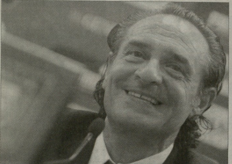
ჩვენარ პრინცილის გაერთიანებული შემადგენლობა დასახულა