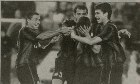
ინტერმა თავისი ყოფილი მწვრთნელის გუნდს შავი ღლე აყარა