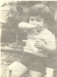
მ. რა ბავშვილია?