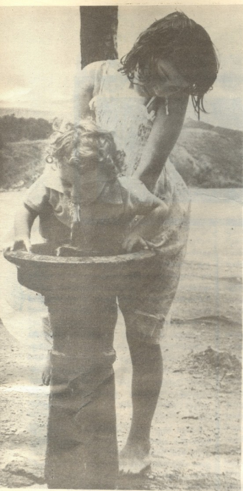
ცოტა მის ლავობენ