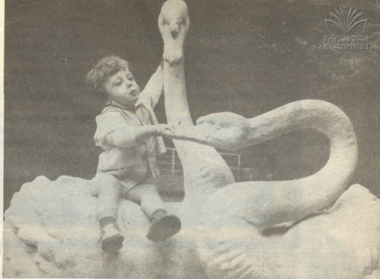
აქო, აქო ბედო