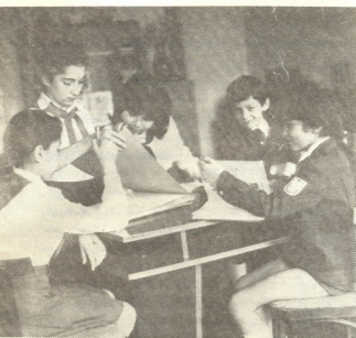
88-ე საშუალო სკოლა. მოსწავლეები ათავალერებენ ალბომს.