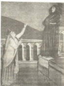
„ღაღადი“. ზეობი — ზ. ახლად ისინი — ა. სახელმწიფო

დაპირველს „რელიგიის“ წარმდგამ სპექტაკ- ლის დამთავრების შემდეგ, კონკრეტული სახალხო სტუმრისა, ლეონტიძისა დახვე- დის შემთხვევების სახლის დირექტორმა მე. კოხლავამ ახელაქვეყნა მისთვის მუ- ხარებისა და მფარველების, სპექტაკლი, რომელიც დღეს მე აქ ვნახე, — თუა მან — გემოვნა, შეიძლება ითქვას, რომ პარადი- აღმოჩენა. სპექტაკლი რომელიც მე აქ მოხილენი ვნახე, მისი გმირებისა და