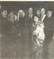
„გზა უკავალდებოდა“ პატრონობის შემდეგ

ეს დღე ზემოთა დირხსახოვანია, დიდხანს გაიწევა, თითქმის სიციხეებზე ხელს და აწევა! და შარადღე, შავიღა ობოლანე სიციხეების უკანასკნელ წივებშიღე დიდი გარდაბოთ განაგრძობდა თავის საყვარელ საქმიანობას.