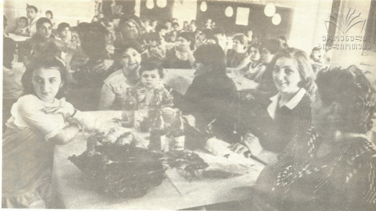
3. მანგაურიზ ფოტო

ზღვა სიმღერებისა, ბავშვების ქვივლ-ხივილით გაივსო იმ დღის თბილისის შრომის წითელი დროშის ორდენისანი სასოფლო-სამეურნეო ინსტიტუტის ბიბლიოთეკის ასპიითხელი დარბაზი.