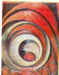
მზაქარის კონცეფციის თემატიკაზე, კონსტანტინე