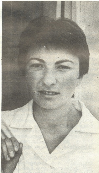
პროდუქტული ღირსი მეთოდით

სიტყვა „გადახარჯვა“ გვიჩვენებს საქმიანობის დიფერენციალს. მისი ადგილი მტკიცედ დაიკვივდა „ეკონომიკაში“. ერთი ცენტრირი ზორცის წარმოებაზე 9,5-ის ნაცვლად დახარჯულია 8,97 საკვებითი ერთეული