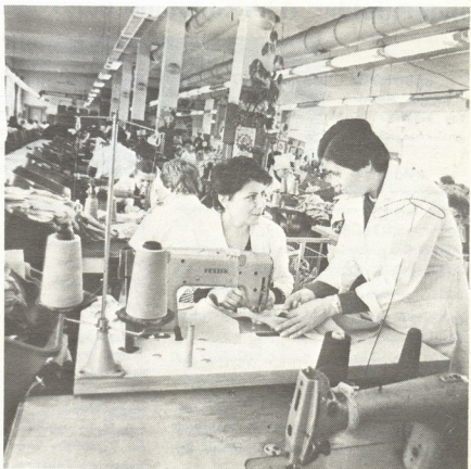
აპირებენ პროდუქციის ხარისხს