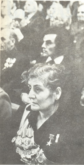
ზაირა აღზანიშვილი სტუმრობდა დარბაზში

ამ სოფლის და კოლმეურნეობის, არამედ მთელი წითელწყაროს რაიონის მშრომელთა ზემო იყო. კოლმეურნეობის თავმჯდომარესთან ერთად შეიქმმა კოლმეურნემ საქართველოს სსრ ხელმძღვანელ სპობსპრეზიდიუმის სამსახურში სხელი დამსახურება.