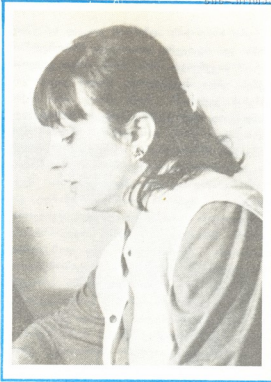
№ 218 აფთიაქში უფასოდ ეტლევით წამლებით ოს და მეტშეობლიან ოჯახებს, რომელთა ბავშვებც არასრულწლოვანი არიან.

მშობლებთან რაიონული საზოგადოება ვასაუბრებელი ურადლებას უმობის მრავალშეობლიან და მარტონელა დღებთან მუშაობას. ამავე საზოგადოების ინიციატივი