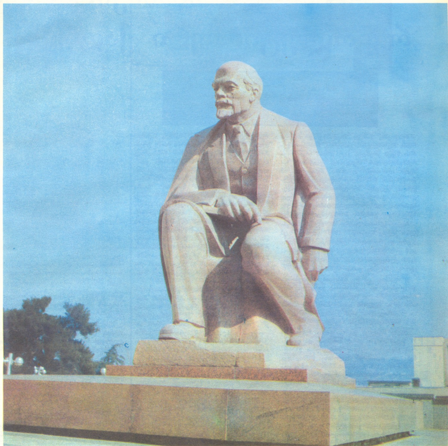
3. ვ. ი. ლენინი — მოქანდაკე სპარტაკო ლოს სსრ დამსახურებული მხატვარი მ. ყიფიანი