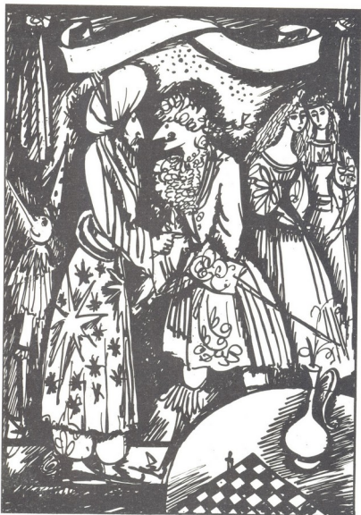
სპეკოლურ ნებატიომ — შინი ბაპიიპის კეპეპეპე