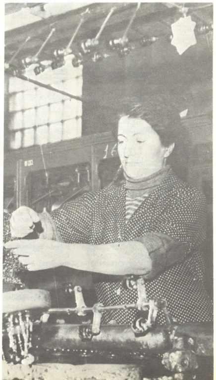
მომსახურების მუშაკი მარტო

სამტრედიის აბრეშუმის ძახსახვევ-საგრიზი ფაბრიკა არა მარტო სამტრედიის რაიონში, არამედ რესპუბლიკაში უძველესი და დიდი შრომითი ტრადიციების საწარმოა, ხოლო თავისი სპეციფიკის საწარმოთა შორის ის ერთ-ერთი ფლაგმანი წარმოება კავშირის მასშტაბით. მარტო ის რად ღირს, რომ ქართული აბრეშუმის ესოდენ გახმაურებული აღიარება ამ საწარმოს დამსახურებაცაა. კერძოდ, აბრეშუმის მაღალხარისხოვანი პარკის შერჩევა და ამ პარკიდან ასეთივე მაღალი ხარისხის ძაღის ამოხვევა, მისი სწორი, მაღალხარისხოვანი დამუშავება იყო და არის სამტრედიელ დამსახურებულთა უპირველესი მოვალეობა, მათ კარგად ესმით, რომ ძაღის ხარისხზეა დამოკიდებული აბრეშუმის ქსოვილისა და მისგან შეკერილი ნაწარმის საბოლოო ხარისხი.