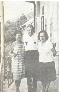
უძლია პილი და მისი მიწაღულ საშობაო გენალი ურუშაბინთან

ჩია და ჩვენი განურები ვიკავით. ის დღე არ დამავიწყდება, ვენერა მოვიდა ჩვენ- თან. ხელში ჩიტის გალია ეტერა, გამოი- წოდა და მიხარა: ჩვენ სამშობლოში უნდა დავბარდდით, ჩვენს სამახსოვროდ ამ ბულ- ბულს გიტოვებო. ვენერა, როცა მღეროდა, ვეუბნებოდით ხოლმე, რა ბუღბუღლის ხმა გაქვს-მეთოქ, მიგზვდი, რომ ჩიტის სიმღერას ვენერა უნდა გაუხსენებინა ჩემთვის. დღი მადლობა გადაუხადე. მძიმე იყო ჩვენი განწორება, მაგრამ დავპირდი, აუცილებლ- დად გავწვიო და შენს სამშობლოს მეს ვინახე მეთოქ.