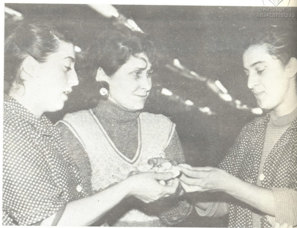
მოწყობა მადის ხარისხი

ამვე სამაქროში გაგვრგვალა დანარჩენი ყველა საჭირო ტექნოლოგიური პროცესის დახვეწაც: ამ პროცესმა 1986 წელსვე იძლეა საფუძვლიანი და ფეხსმართი შედეგი მისცა მეცნიერებსაც და წარადგინებდასაც, რომ შარში ფაბრიკა ახალ ტექნოლოგიურ, ანუ როგორც ამ უკვე ეძახიან, ჯიხარაძისულ ციკლებზე მთლიანად გადაიყვანეს.