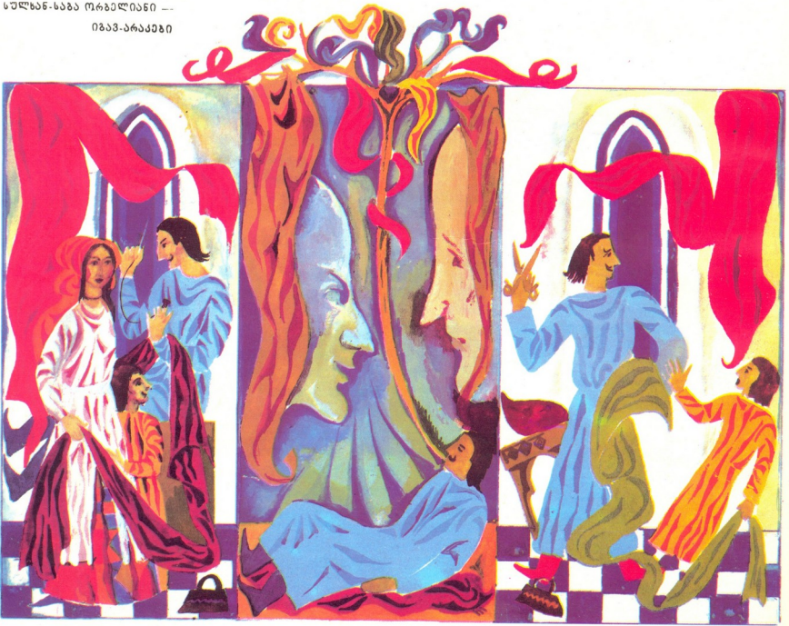
სულხან-საბა ორბელიანი — იბავ-არაქები

მის მიერ გაფორმებულ წიგნებს საკუთარი სა-