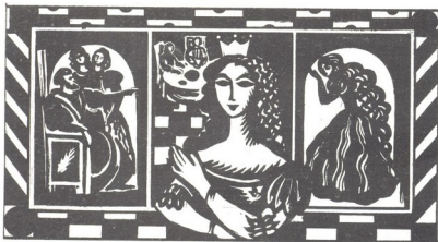
ბოჰემა ნეშტოვა — ბარილი ოპროჰე მირჰანი