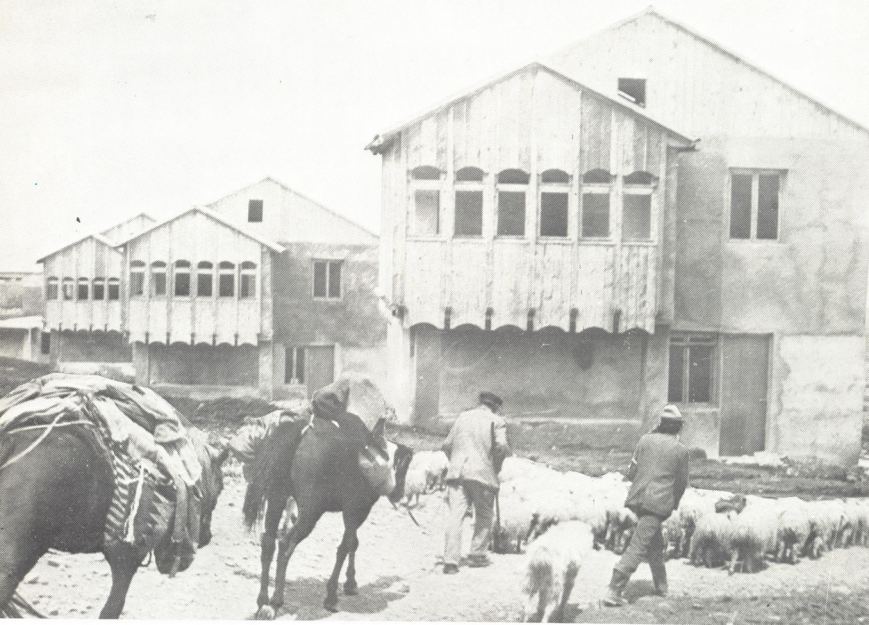
ს. იაშვილის ფოტო

იარეს. იარეს და აქ შეჩერდნენ—დიდი საბას მიწაზე. ეგონათ, ბარად ჩამოსულაო სვანეთი. მანამდე ბოლნისის რაიონის ვაკე ადგილები ისე მოათავეს, თვალი არსაით გაქცევიათ, და უცებ, ლურჯი მთები რომ ამოისვეტნენ — გაოცდნენ. თურმე სად უცხოვრია საბა ორბელიანის წარმოდგენელი ძალა ჰქონებია ტანძიას — საქართველოს ამ ნამცეცა მიწას — გიპურობს, სულს გიმალდებს, უყუერბ და გრძნობ, როგორ ტყვევდები.