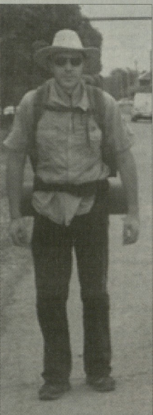
უწყალმდე გაბრუნებული 522-კოლომეტრიანი გზა გადახედვით 560 კოლომეტრამდე გაიხრდა. მოგზაურებს ეს მანძილი 7 დღეზე გრძელად, მაგრამ მიულოდნელად პრობლემება დადაცრთობდა და დაფრთხილებდა. თქვენთვის მნიშვნელოვანი მანძილი რამდენიმე საათში გაიშრდა.

უწყალმდე გაბრუნებული 522-კოლომეტრიანი გზა გადახედვით 560 კოლომეტრამდე გაიხრდა. მოგზაურებს ეს მანძილი 7 დღეზე გრძელად, მაგრამ მიულოდნელად პრობლემება დადაცრთობდა და დაფრთხილებდა. თქვენთვის მნიშვნელოვანი მანძილი რამდენიმე საათში გაიშრდა. თქვენთვის მნიშვნელოვანი მანძილი რამდენიმე საათში გაიშრდა. თქვენთვის მნიშვნელოვანი მანძილი რამდენიმე საათში გაიშრდა.