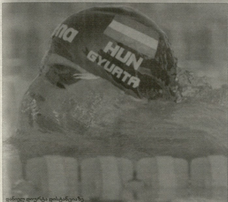
დასწრე დორტა დისკრინაზე