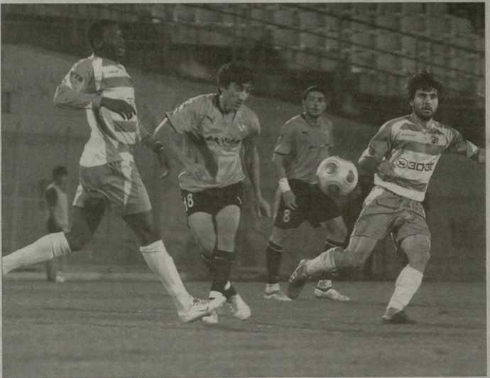
XXII ჩემპიონატი, დანამო-უჩხატური 24

„არგონული ჩემპიონატის დონე თუ არ ამალდე, ჩვენი მოედნის თითქმის აბსოლუტური უმრავლესობის მდგომარეობა თუ არ გამოსწორდა, ნიჭიერი ბიჭები თუ არ გამოჩნდნენ, მაშინ სანაკრებო ამბიციები უნდა დავიწყებოთ...“