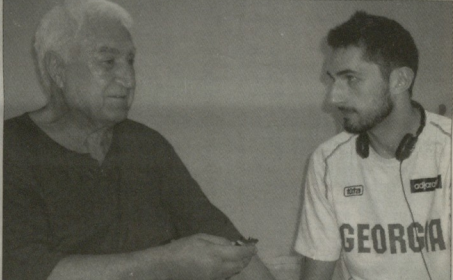
ბაბა და შვილები