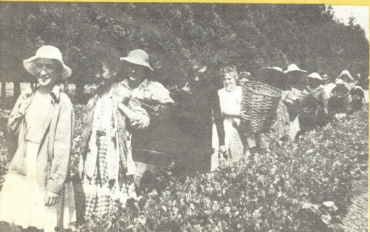
უგანრიგო რგოლის წევრები

— ჩვენს ჩაის ისეთი არომატი უნდა დავუბრუნოთ, — ამბობს