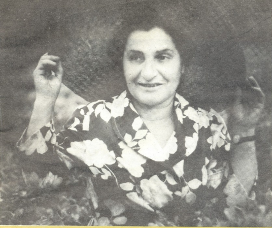
საკაშეშის კონსერვების ფაბრიკაში მამუცა

რომელი კომუნისტი უღვას მხარში ნაღდი სიტყვითა და საქმიანობით მზე შამუგიაო, — ისიც ამგვარად იტყვის.