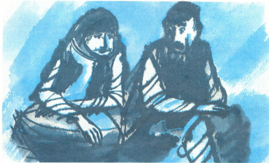
მსატყარი ძარღვ შახლული