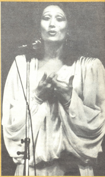
...როსი ზრდილიც გარდებიწევა, არ შემაწხდება, იქ რა იქნება, რადგან აქ, შენთან, ლეკიანობი წესად თავბრუდასხმული ვუვლიდ ამქსა..."