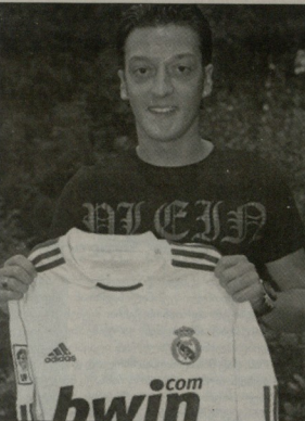
მესიო იოზილი რეალის მასიორი