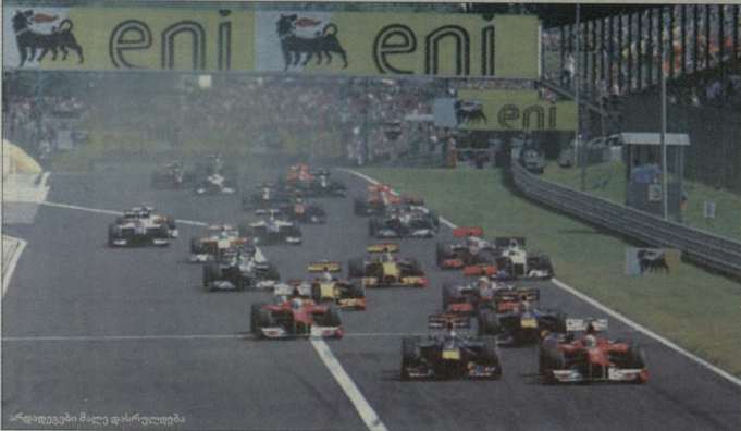
არდადეგები მალე დასრულდება