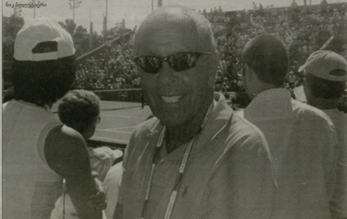
ნიკი და მისი მოსწავლეები