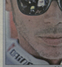
რისი ფორმულისკენ იფერება

სასულე და სწრაფ მოსახებებში მაკლარენს, შესაძლოა, უპირატესობა მიმოიგოს. ფერარის ე, ოლიდ ინიერება უნდა იყოხაილ დიფუზორთან დაკავშირებით.