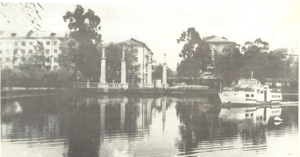
ბათუმის პონტროსი პარკი