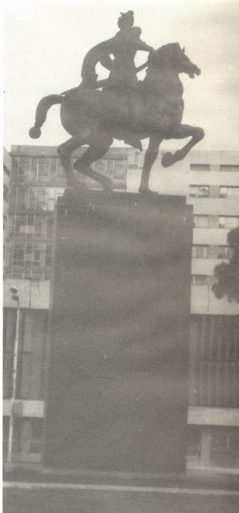
ბიორგი საბაკის ძეგლი თბილისში. ღ. იაკობაშვილის ფოტო