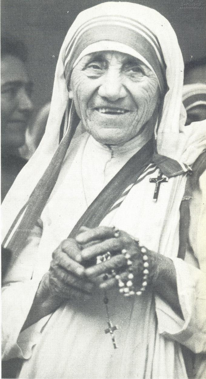
დედა ტერეზა — ახანს გონჯა გოლდისკუ

მსოფლიო იცნობს დედა ტერე- ზას — მშვიდობის ნობელის პრემი- ის ლაურეატს, ინდოეთის კათოლი- კური ეკლესიის მონაწილს, ღვთის- მეტყველების მეცნიერებათა დოქ- ტორს, მოწყალეების ორდენის დამა- არსებელს, რომელმაც უწყომანოდ გამოსწია ჩვენსკენ, ღვთისმშობლის წილხვედრ ქვეყნისაკენ და თან ჩა- მოიყვანა მოწყალეების ორდენის რამ- დენიმე წევრი. დედა ტერეზამ და- ლოცა საქართველო და ისე წა- ვიდა, მაგრამ დატოვა მოწყალეების ღვთი ხანგრძლივი დროით. მათი მი- ზანია შეუმსუბუქონ ტანჯვა და ანუგეზონ ყვილა ვისაც ეს ესაჭი- როება, თავიანთ კვალზე მოამზადონ ქართველი მონაწევრები — სიკეთისა და ქველმოქმედების გზით რომ ია- რნ.