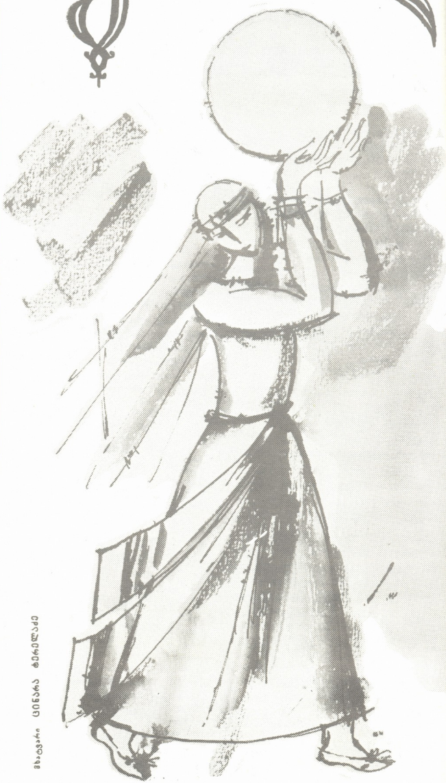
მხატვარი ცინცარა ტაბრილაძე