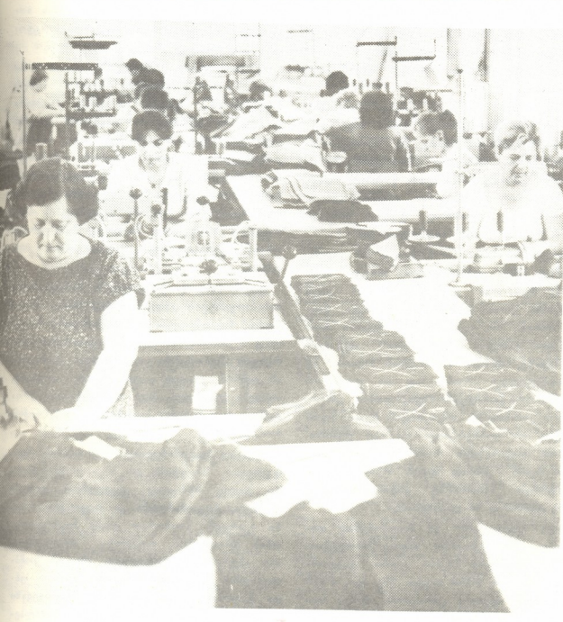
მ. მ. სამკერვალო საამქროში